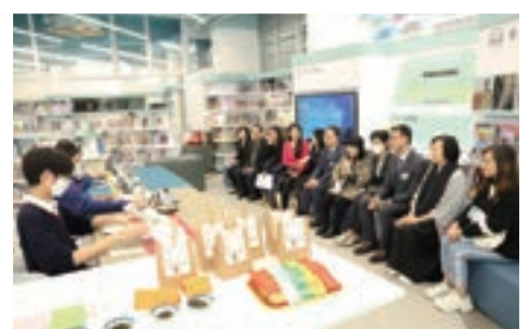
嘉賓參與茶藝體驗活動