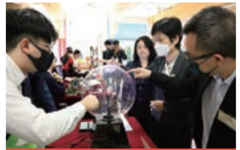
學生向嘉賓展示學習成果