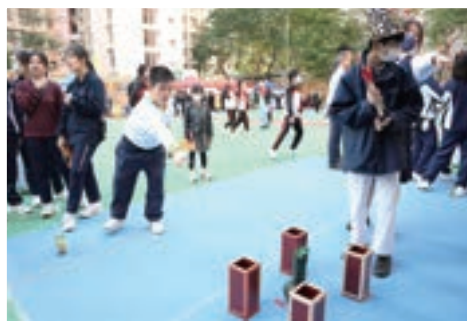
學生投入參與學科攤位活動

本年度適逢萬鈞教育機構 55 周年、賽馬會萬鈞毅智書院 25 周年校慶，本校於 2023 年 12 月 1-2 日期間舉辦「二十五周年學科成果展暨英語音樂劇」(學校開放日)學科成果展，利用學科展覽、體驗活動、攤位活動及學生表演，讓學生展示所學，與一眾出席的嘉賓、學生分享學習成果。