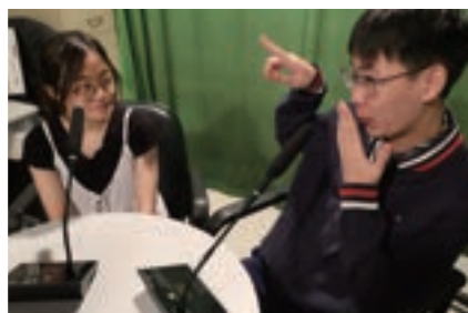
Warbucks is very rich but kind