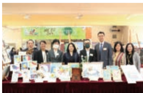
嘉賓參與學科展覽