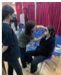
Parent volunteers are doing makeup for our actress. Their marvellous makeup skills are professional.