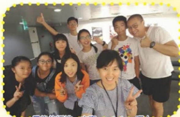
最後的綵排。大家good show啊！

過去暑假，我代表學校參與澳門 Theatersports 比賽，我慶幸我能夠作為「香港外賣仔」這隊裏其中一個成員。在臺上表演後得到的讚賞，把之前的困難和挑戰轉變成為快樂。我榮幸有機會參與 Theatersports 活動，讓我更深一層地知道，每個人的人生沒有劇本，劇情怎麼發展，全不到我們操控，但只要我們努力，所有都能改變。