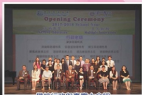
學校行政與嘉賓大合照