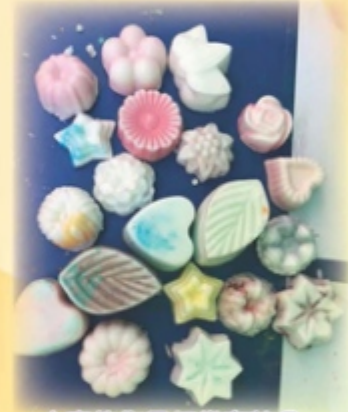
大家的作品相當有特色