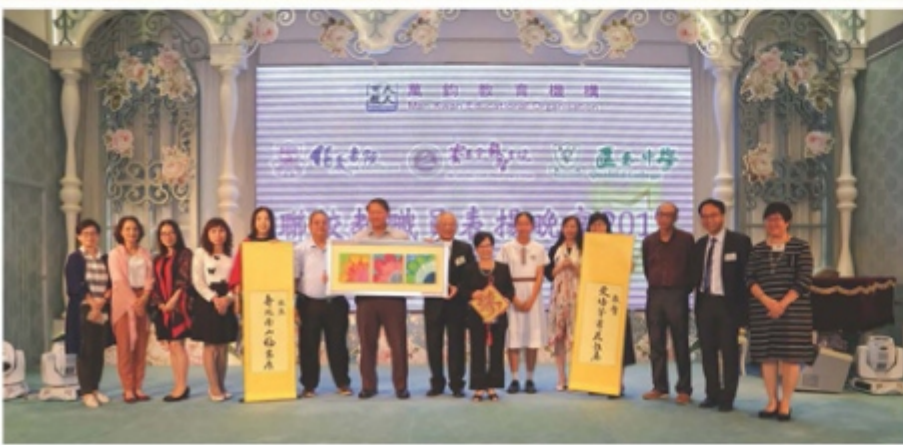
教職員及家教會贈送禮物給校監