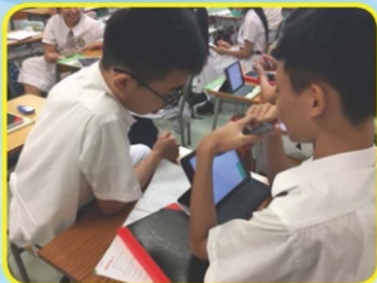
2A班同學透過電子平台Mathspace學習數學