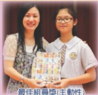
最佳組員獎(主動性)