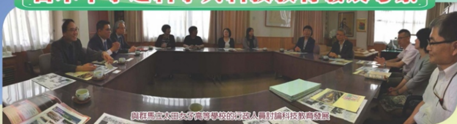
與群馬立太田女子高等學校的行政人員討論科技教育發展

現 今全球科技的發展速度，瞬息萬變，在世界快速變動下，教育興起了創新求變的能量，我們亦推動STEAM教育，讓學生「動手做 - be a Maker」，發揮他們的潛能，培養創新、批判、解難、合作及溝通的能力，培育優質的人力資源，協助他們發展科技能力，去面對未來社會的挑戰。我們一直致力推廣學生之科創發展及研習，提升學生的學習興趣，以助他們日後在有關範疇升學和就業，應對現今世界的轉變所帶來的挑戰，並鼓勵同學參與校外科研比賽，擴闊眼界。