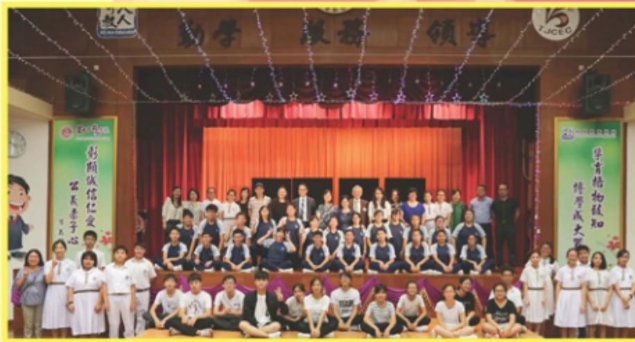
表演同學和嘉賓大合照