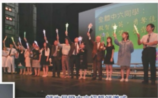
師生見證中六級誓師儀式

最後是學生會代表的敬師環節，邀請全體嘉賓及老師上台，送上學生代表親筆書寫的「百恩圖」給校監和校董，當然少不了為全體老師精心準備的小禮物。眾人的掌聲伴隨著鋼琴聲，在歡樂氣氛下為開學集會劃下句點，也掀開了新學年的序幕。