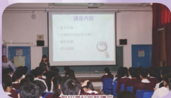
聯招選科策略講座