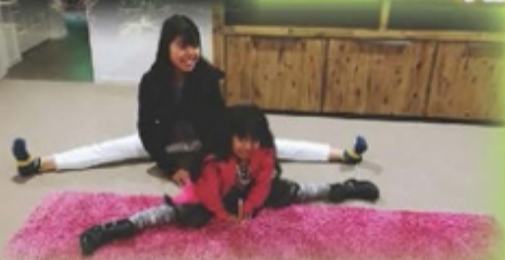
Wonderful time with host family