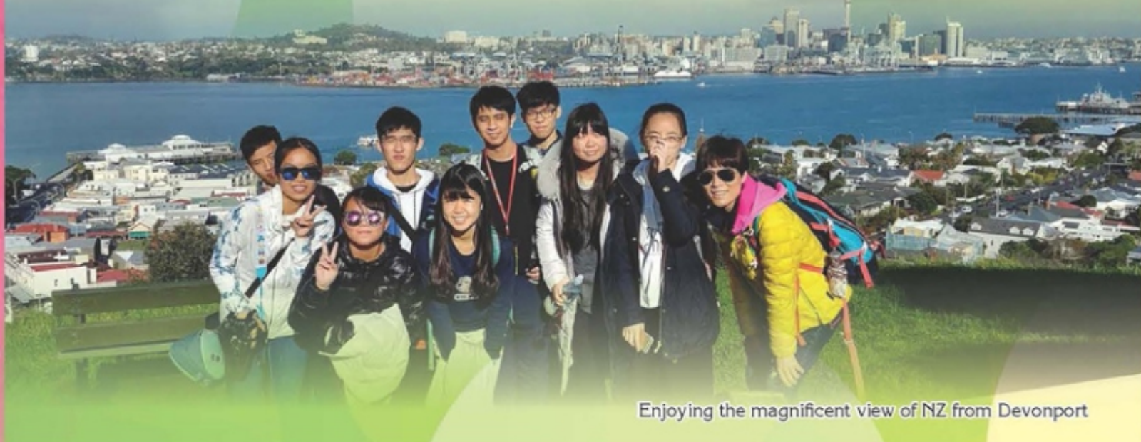
Enjoying the magnificent view of NZ from Devonport