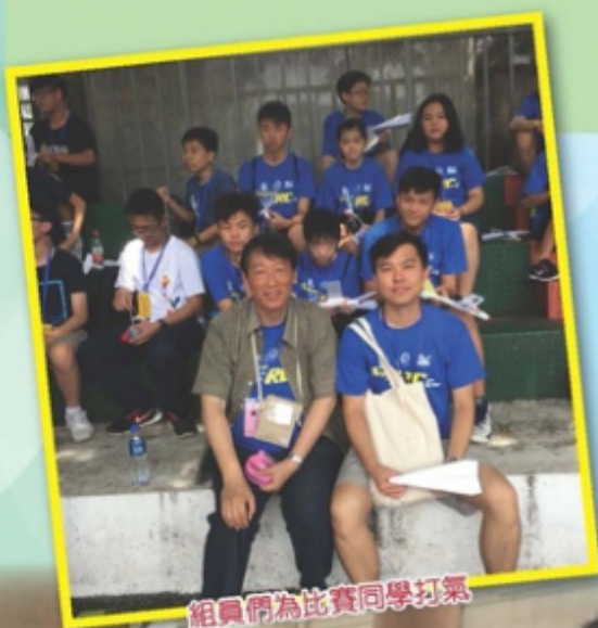
組員們為比賽同學打氣

我 對這次廣州行程感覺十分良好，參觀黃埔軍校等行程相當之豐富，令我學識不少歷史知識。在「海陸空模型鐵人三項邀請賽」當中都令到我們接觸到更多新奇玩意，例如遙控船、安全車、模型飛機等。在廣州，原來這些玩意，除了消閑娛樂外，也是當地中學和小學的正規課程，可以說在廣州，生活就是科技，科技就是生活。這也是在這活動中最深刻的感受。