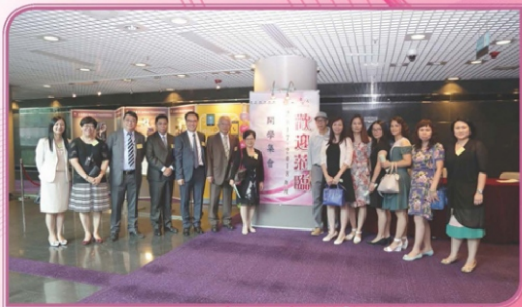
家教會委員出席本校九月份的開學集會