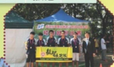
男子甲組團體亞軍