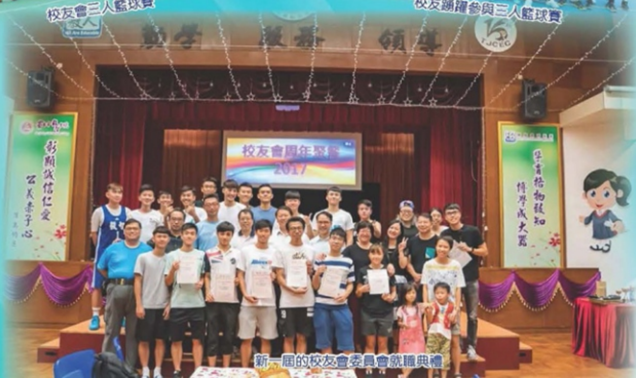
新一屆的校友會委員會就職典禮