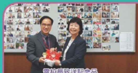
雷校長致送紀念品 The Gunma Kokusai Academy的校長