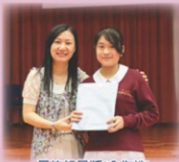
最佳組員獎(合作性)

自主學習提升我的學業成績，因為這模式讓我對學習方面的興趣提升，讓我有動力自發去學習更多新的知識，而且學校為我提供多元化的課堂活動，讓上課氣氛更加生動有趣。