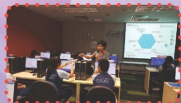
導師分析不同的性格特徵

9月29日我們去了天晴村僱員再培訓局參加生涯規劃活動，在活動裏有導師向我們介紹與工作相關的課程，而讓我們驚訝的是當中的課程大部分都是免費的，幫助經濟有困難的同學解決學費問題。除此之外，我們通過性向及職志測試問卷，了解自己的性格特徵，更清楚合適自己的工作。為了令我們清楚理解面試的場景，我們更進行了模擬面試，我有幸被邀請作親身體驗，就算面對的是同學，也能令我學習了不少面試的技巧，例如：面試時的說話技巧和身體語言，我真的上了寶貴的一課。