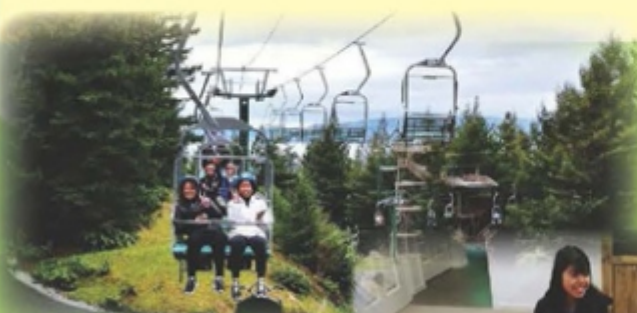
A fun day in Rotorua!

In New Zealand, there are many things different from in Hong Kong. Like taking the bus, you need to tag on and tag off your card, sometimes we just forgot to tag off and it charged me the fare of the whole journey, it was very expensive. People in NZ were very nice, they always said "Hi" to you politely and you could see people from different countries, it was like in United Nations. One of the special races is called Maori; they are the indigenous people in NZ. Learning their culture in Auckland Museum was fun. We learnt the ways they danced and sang, roaring was a very typical feature in their performance. Last, the weather in NZ was very different from that in Hong Kong, it rained every day in winter, and it was really freezing, especially in the morning and at night. So we all think that we will visit New Zealand in summer next time to explore another side of this wonderful place.