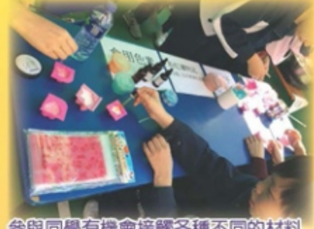
參與同學有機會接觸各種不同的材料

除環保活動外，本團團員還在學校假期邀請了附近長者中心的長者來校參觀。他們對學校環境及中學生生活十分有興趣。在活動當天，學生們跟長者一同參與遊戲，長者還教導學生，作出藝術創作，學生們獲益良多，長者們與學生們都非常享受當天的活動。