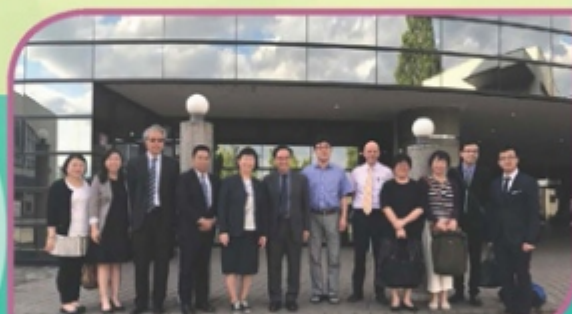
與The Gunma Kokusai Academy 行政人員交流後合照