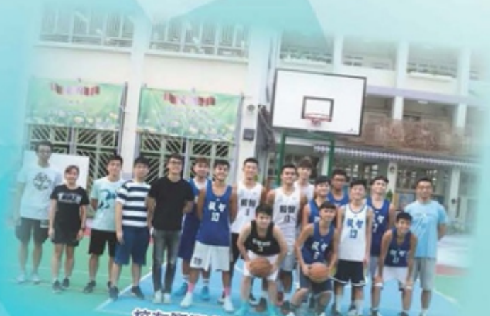
校友踴躍參與三人籃球賽