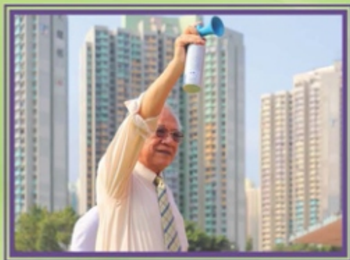
校監譚萬鈞教授為比賽進行鳴槍儀式