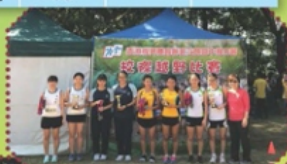
女子甲組團體第六名