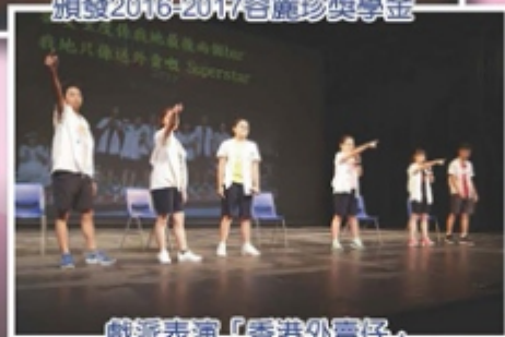
戲派表演「香港外賣仔」