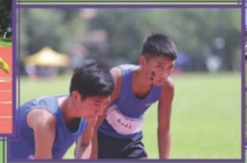
中六畢業生準備起跑