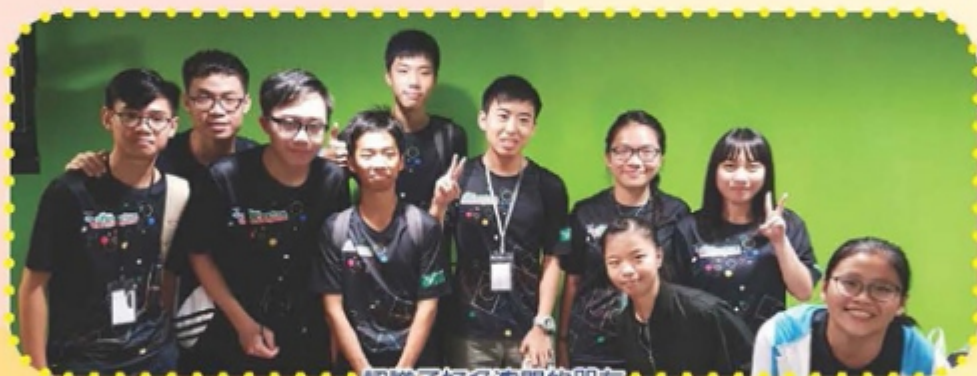
認識了好多澳門的朋友