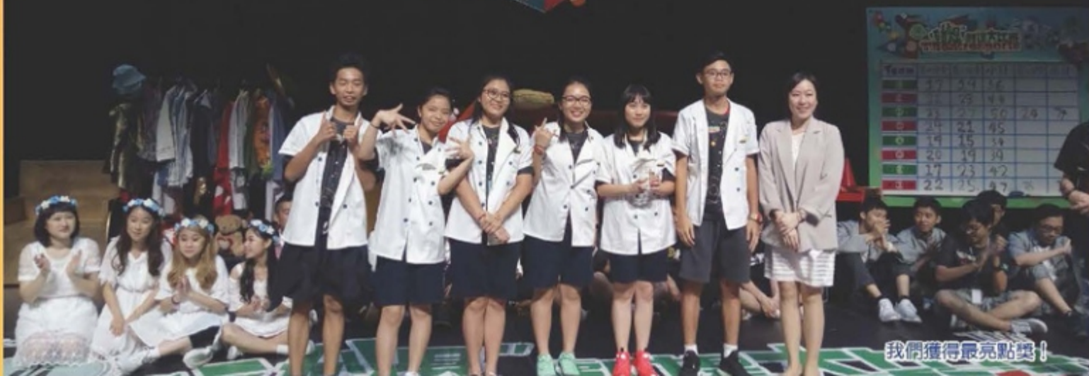
我們獲得最亮點獎！