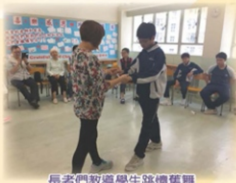
長者們教導學生跳懷舊舞