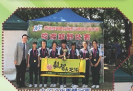
女子乙組團體冠軍