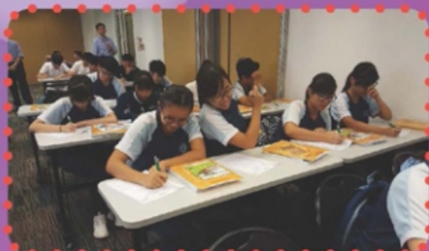
同學認真完成問題