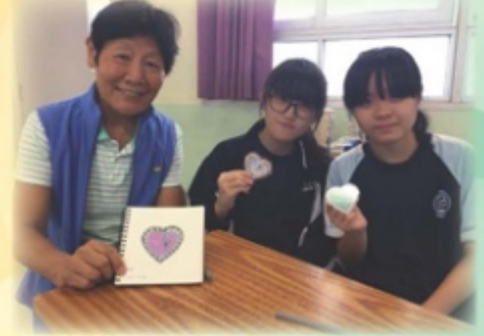
長者與團員一起創作藝術作品