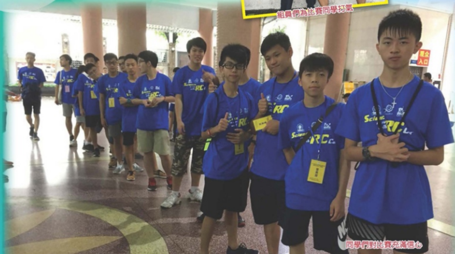
同學們對比賽充滿信心