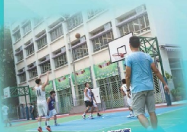
校友會三人籃球賽

離別校園十年，人物雖有變遷，但是回到母校，想起當年校園生活的情景。每年的校友聚餐上我們都能和老師聊個痛快，除了可以回憶當年，亦可以交流近況，分享離開校園後的生活點滴。希望各位校友繼續鼎力支持我們校友會接著舉辦的各種活動，期待大家的踴躍參加。