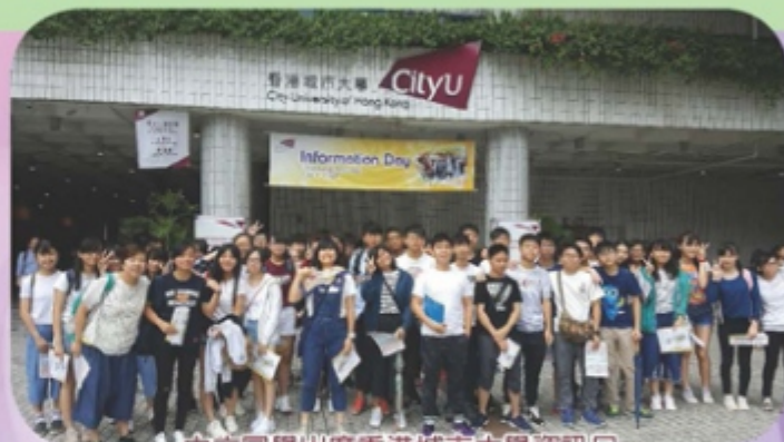
中六同學出席香港城市大學資訊日

雖然城大並不是我的目標，但這次參觀更加確定了我想入讀教大的目標！在日後，我希望也能成為大學生，能夠在大學的資訊日中遇見師弟妹們，勉勵他們。