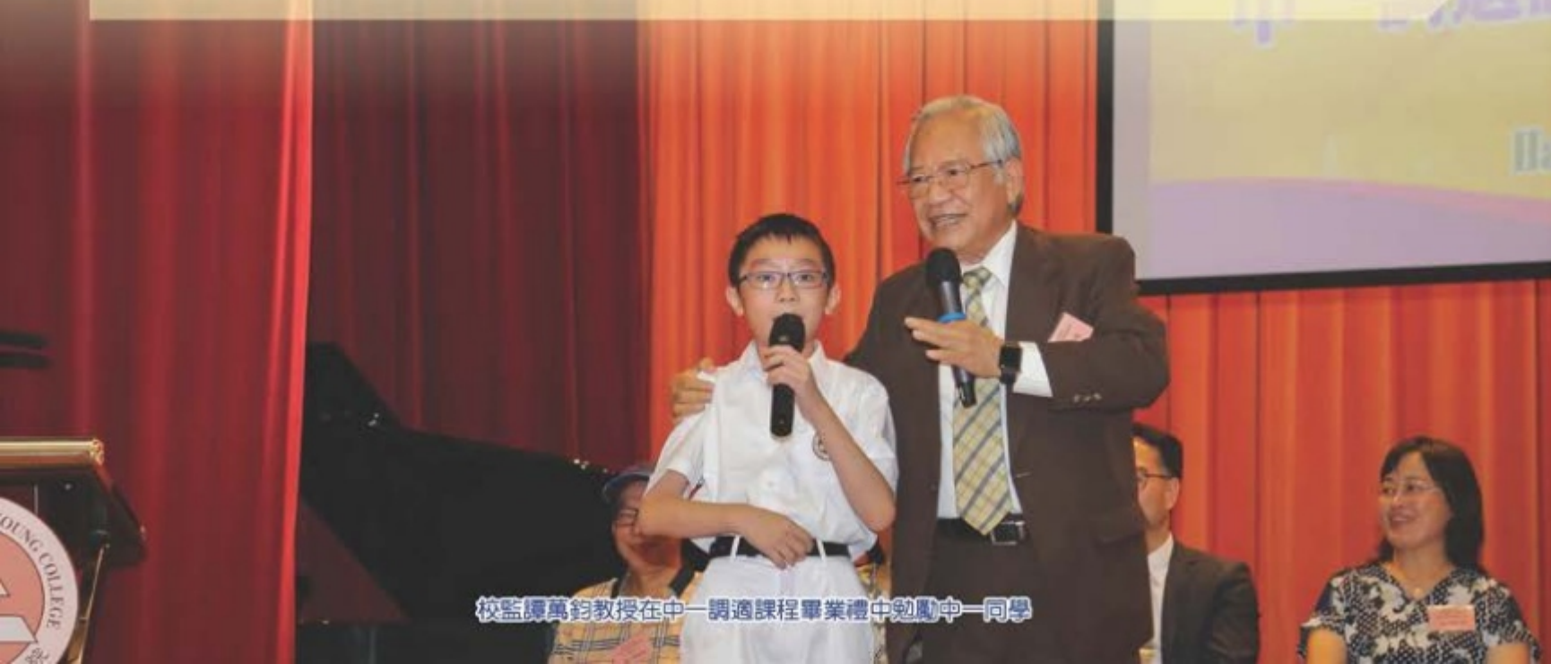
校監譚萬鈞教授在中一調適課程畢業禮中勉勵中一同學

學生們遊走不同地域的文化體藝考察活動，如台灣、澳洲、英國、日本等地的遊學團；此外，學校組織文化交流活動，如加拿大同學會和美國婦女會的英語活動、日本高中學生到校的中日交流活動等，同學置身在多元文化的氛圍中，皆可體驗不同文化、增進溝通技巧，從而培養學生的國際視野，令他們在瞬息萬變的全球化社會中，成為具識見、抱負及競爭力的公民。