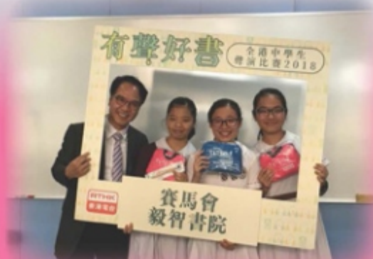
校長與進入複賽的三位同學合照