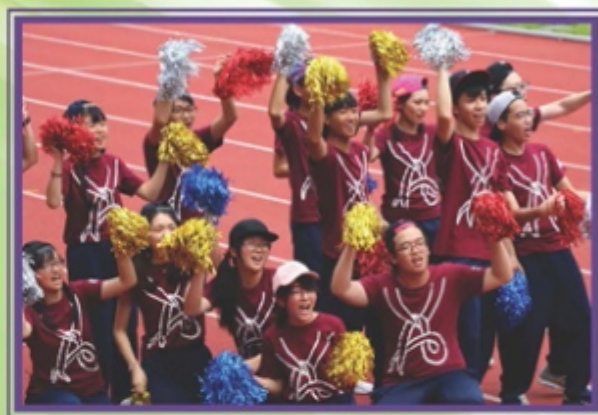
啦啦隊決賽表現投入