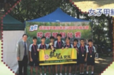
男子丙組團體冠軍