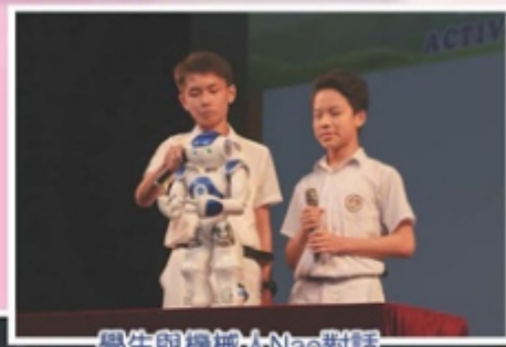
學生與機械人Nao對話