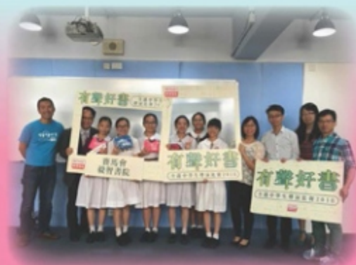
獲得優秀表現的六位同學