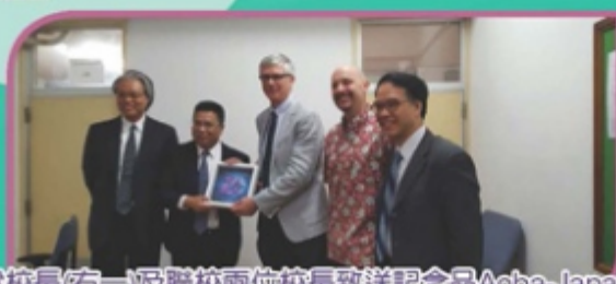
雷校長(右一)及聯校兩位校長致送紀念品Aoba-Japan International School的校長(右三)