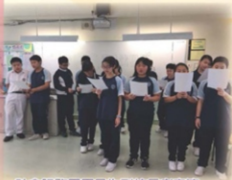
社會服務團團員為到校長者表演