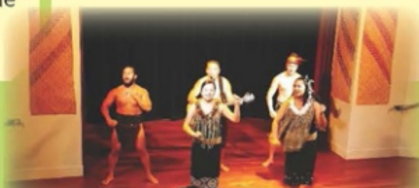
Maori Show at Auckland Museum