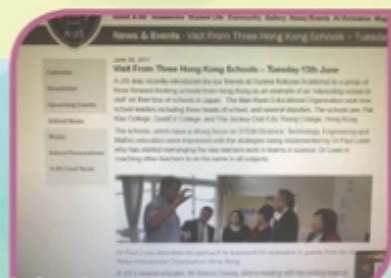
Aoba-Japan International School 報導本機構訪校的訊息

環顧亞洲地區中，日本之科技工作發展日新月異，而近年日本教育省推動的 Super Science High School (SSH)計劃，於日本全國選拔超過200間優秀中學，協同鄰近大學支援，鼓勵同學於中學階段學習科學探究，誠具本港教育之參考價值。