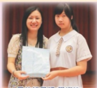
最佳組員獎(學術性)

在自主學習中，我學會了如何做好一個組長的工作。我學會主動地把組員帶入課堂學習，引起組員的興趣，使大家可以一起進行討論，並且做到互相幫助，完成我們的目標。在小組中，若沒有一個人去展開話題，那就不能快速而有效的完成任務。