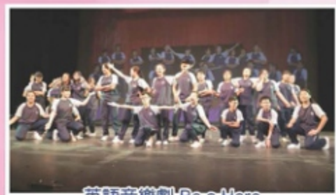
英語音樂劇 Be a Hero