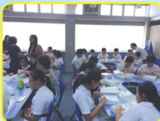
家長及學生在學校檢收訂購的平板電腦