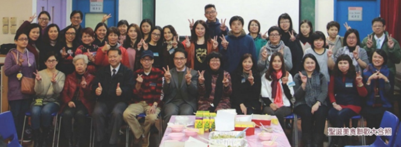
聖誕美食聯歡大合照