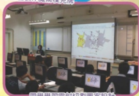
同學學習雷射切割圖案設計