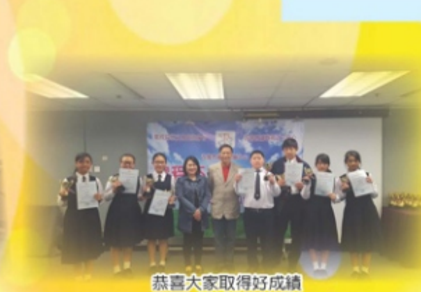
恭喜大家取得好成績