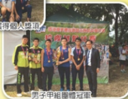
男子甲組團體冠軍