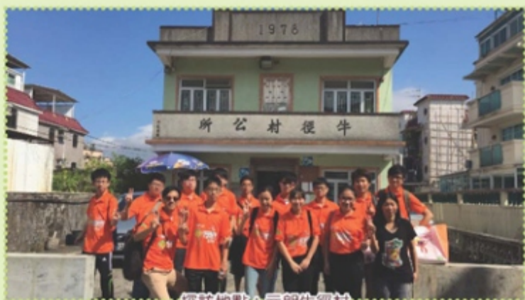
探訪地點：元朗牛徑村

香港精英運動員與香港賽馬會攜手發動「愛心送暖行動2016」，活動中，探訪2,500戶獨居長者及低收入家庭，「EC社會服務團」有幸參與其中。當天的禮物包亦加添了不少環保元素，實行將環保與扶貧兩個元素緊緊相連，既環保亦可以扶貧。