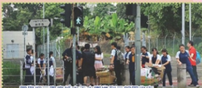
同學把三車廢紙由天水圍推到元朗回收店

在與基督教女青年會合作的「義人同行」活動中，同學體驗及了解到拾荒者的生活，在校組織了「回收比賽」，把收集了的廢紙推到元朗回收店，利用回收得來的金錢購買日用品送贈長者。女青義工把整個活動過程拍攝成微電影，並於聖誕才藝表演中播出，目的是提升同學的環保意識。