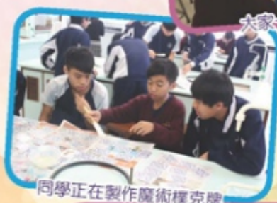
同學正在製作魔術撲克牌