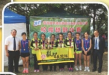
女子丙組團體冠軍