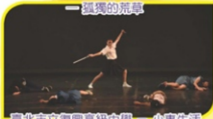
臺北市立復興高級中學——小事生活