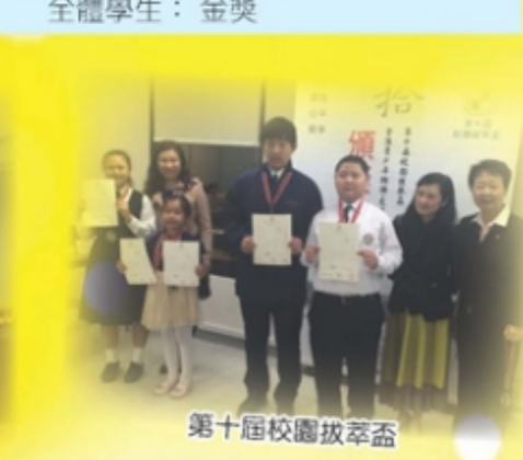
第十屆校園拔萃盃