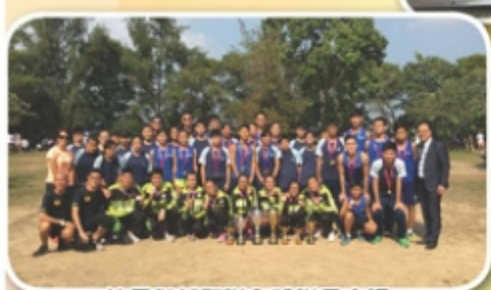
校長與越野隊全體隊員合照