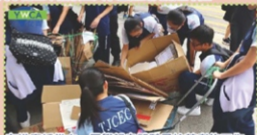
在推廢紙當中，同學親身體驗了拾荒者的工作，從而了解到減費的重要性。