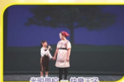
光明學校——快樂王子