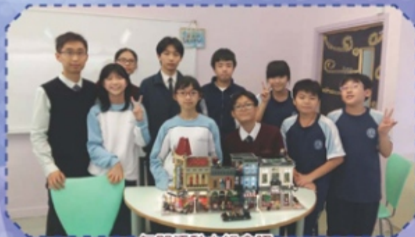
午間活動小組合照