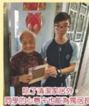
除了清潔家居外，同學的心意卡也能為獨居長者增添暖意。

這次探訪的目的有二，為他們清潔，新年將至，盡量幫他們清潔以減少他們的勞苦，讓他們能輕輕鬆鬆過年。其次，是探訪及了解他們，陪他們聊聊天，說說話已經能使他們樂個半天。說到此，有時他們的熱情真的讓人特別心酸，看見探訪者也就樂得跟個小孩子似的，不禁讓我聯想到他們平日獨自一個的冷清孤獨，該是我怎樣也體會不到的傷感。這些都令我想起自家的外婆外公，亦讓我反思相伴家人的重要。