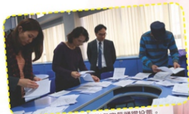
認真的點票，多謝各家長踴躍投票。