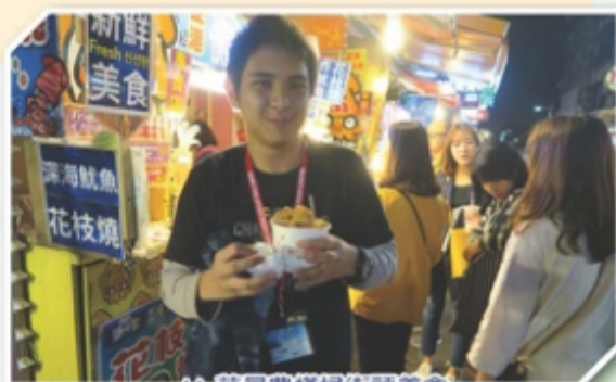
4A-莫景農橫掃街頭美食