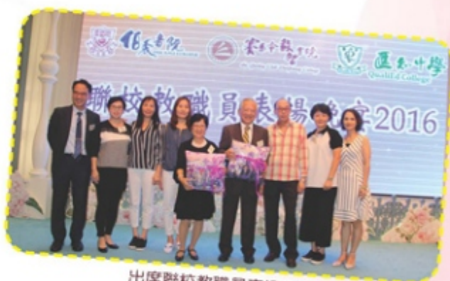
出席聯校教職員表揚晚宴