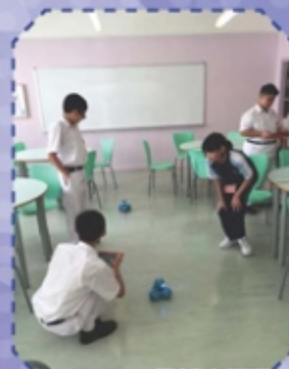
Dash & Dot 機械人活動