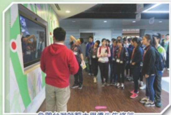
參觀台灣師範大學僑生先修部

這次的遊學團令我更了解台灣文化，認識台灣大學的學習模式，也體會到了當地的風土人情。其中，我更深刻地知道了，不論在哪裏，英文都很重要，特別是聽了淡水大學的主任的講話，強調了英文的重要性。而且在這次的遊學團中，我陪朋友一起面對困難。雖然在面對困難時我也害怕過，但是我們也一起克服了。我想，這次所經歷的事也能增加和朋友們的友誼，我也和朋友一起定下我們的目標，我們會朝着這個目標一起努力，互相勉勵，一起進步。