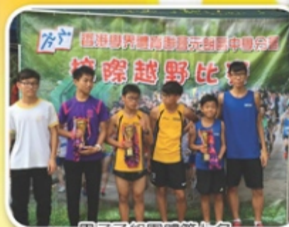
男子乙組團體第七名