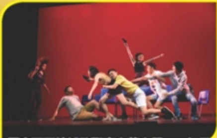
馬來西亞檳城孔聖廟中華中學——如果