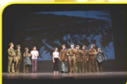
北大附中深圳南山分校——我想有個家