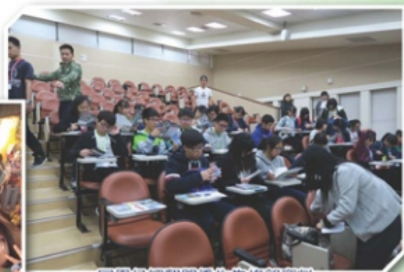
同學仔細翻閱僑生先修部資料