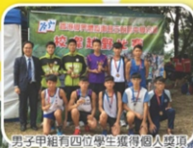
男子甲組有四位學生獲得個人獎項