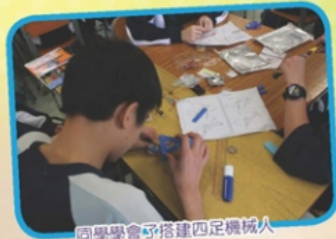
同學學會了搭建四足機械人