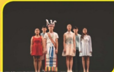
臺灣桃園縣至善高級中學——NEVER GIVE UP