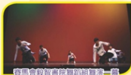
賽馬會毅智書院舞蹈組舞演一篇