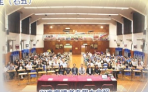
與嘉賓講者來個大合照