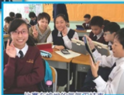
比賽在愉悅的氣氛下結束