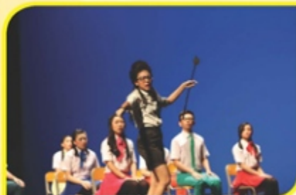
馬來西亞檳城韓江中學 —— Educate-Oh-No