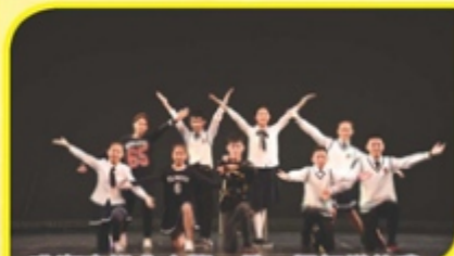
珠海市拱北中學——做一個怎樣的我