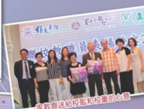
家教會送給校監和校董的心意