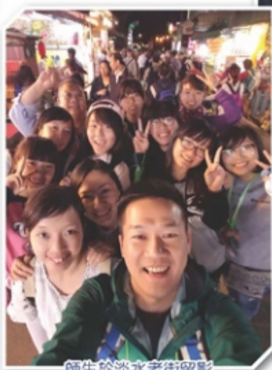
師生於淡水老街留影