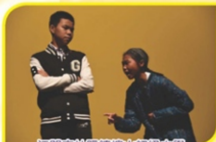
江門市社阮鎮樓山初級中學 ——孤獨的荒草