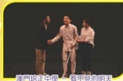
澳門培正中學——看不見的明天