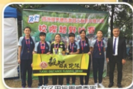
女子甲組團體季軍