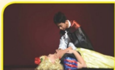
賽馬會毅智書院——我是誰