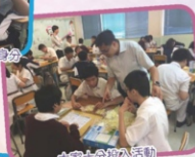
大家十分投入活動