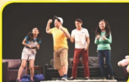
汶萊中華中學——戒掉過於沉迷上網壞習慣改造營