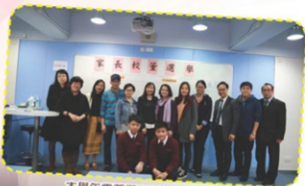
本學年需要選出新任的家長校董