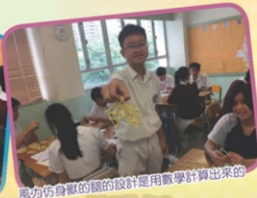
風力仿身獸的腿的設計是用數學計算出來的