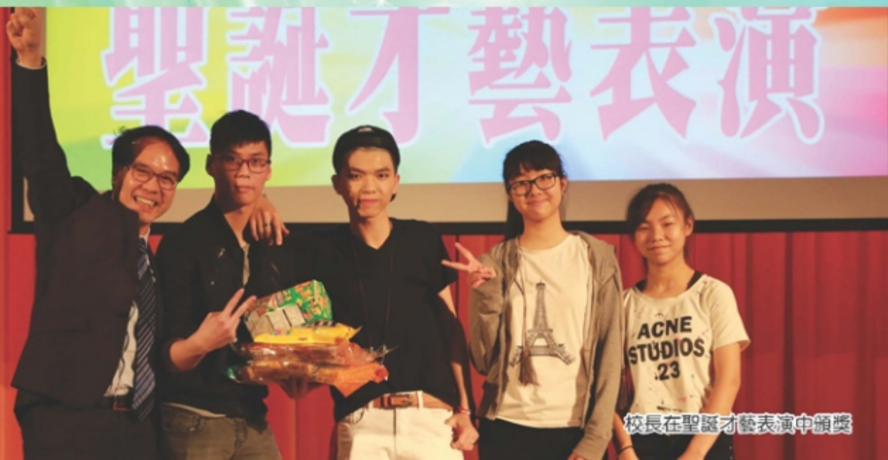
校長在聖誕才藝表演中頒獎

註二：STEAM是“Science, Technology, Engineering, Art and Mathematics”即科學、科技、工程、藝術和數學的縮寫。