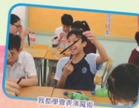
我都學會表演魔術