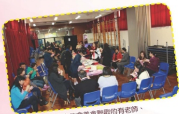
出席家教會美食聯歡的有老師、家長以及學校行政。

不少新家長跟我們聯絡時都會反映到不同範疇的意見，例如冬季校服、午膳供應商，甚至中一級的BYOD計劃。我們歡迎家長透過家教會作為與學校、老師溝通的橋樑。我們明白一年一次至兩次與老師會面未必能讓家長「盡訴心中情」，因此我們更是鼓勵家長多出席家教會的活動，藉此與學校老師多作會面傾談。