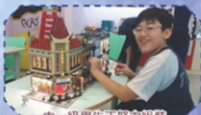
中一級學生正努力組裝