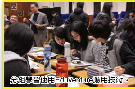
分組學習使用Eduventure應用技術。