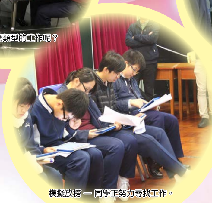
模擬放榜 — 同學正努力尋找工作。