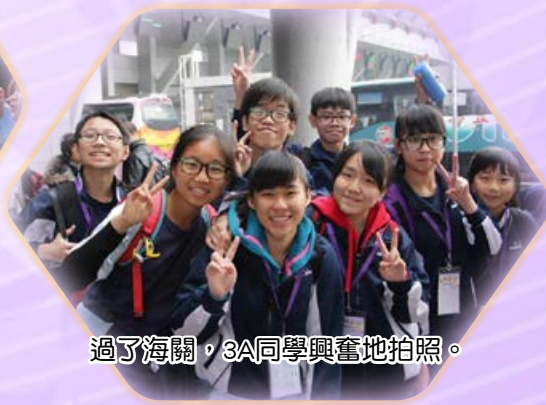
過了海關，3A同學興奮地拍照。