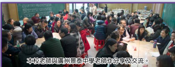
本校老師與廣州景泰中學老師作分享及交流。