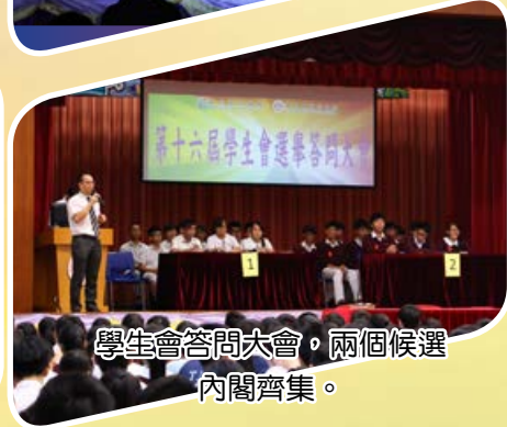
學生會答問大會，兩個候選內閣齊集。