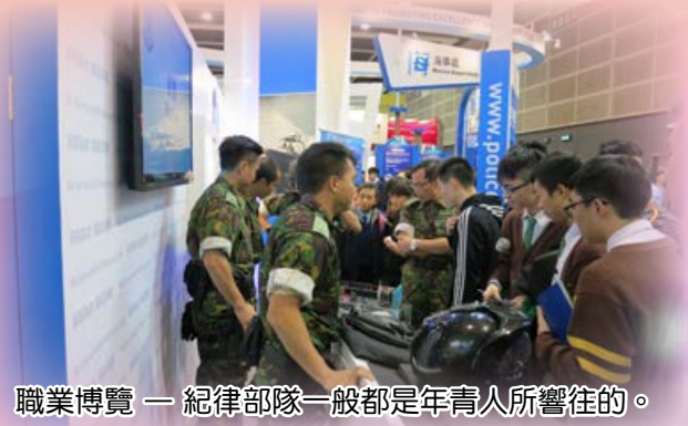
職業博覽 — 紀律部隊一般都是年青人所嚮往的。