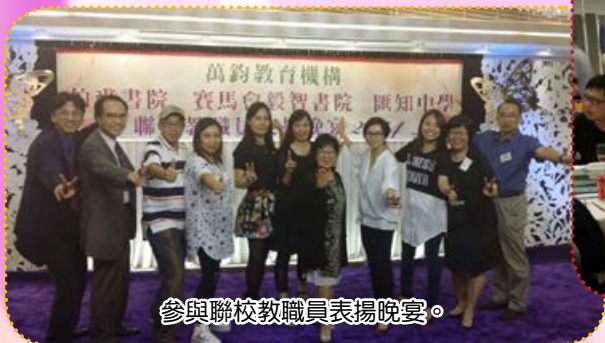
參與聯校教職員表揚晚宴。