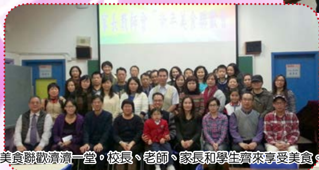
美食聯歡濟濟一堂，校長、老師、家長和學生齊來享受美食。