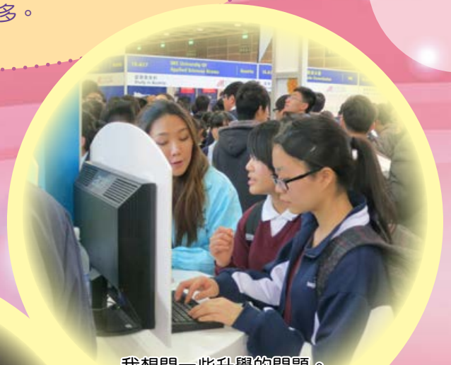
我想問一些升學的問題。