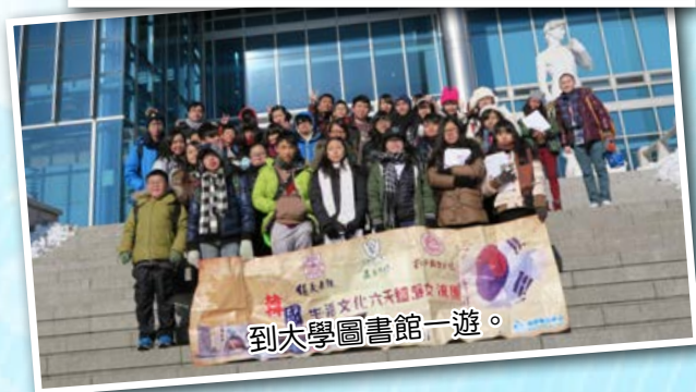
到大學圖書館一遊。