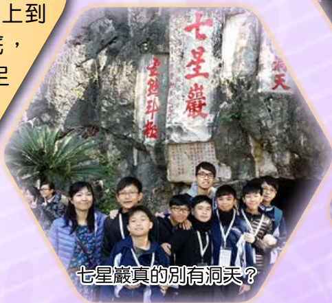
七星巖真的別有洞天？