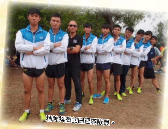
精神抖擻的田徑隊隊員。