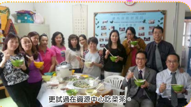
更試過在資源中心吃菜茶。