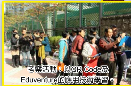
考察活動：以QR Code及Eduventure的應用技術學習。