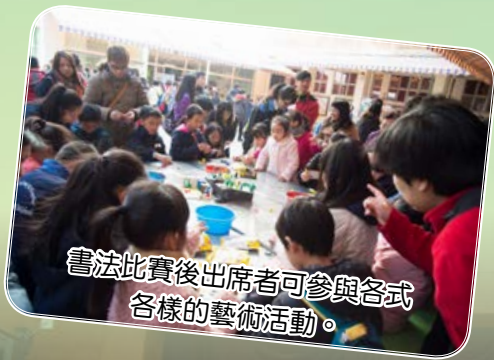
書法比賽後出席者可參與各式各樣的藝術活動。