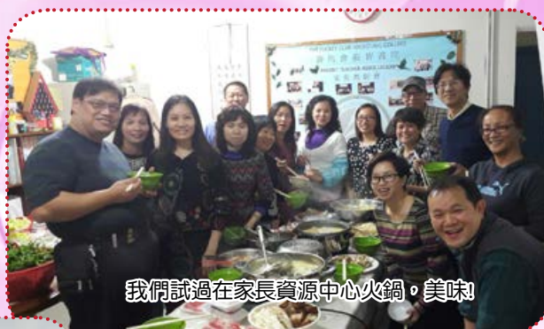
我們試過在家長資源中心火鍋，美味！