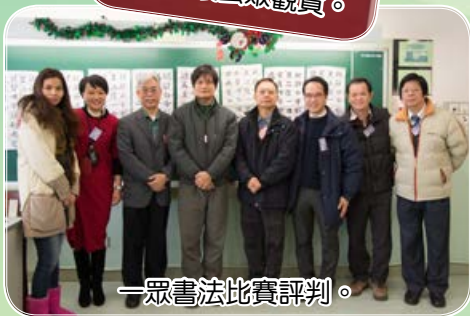
一眾書法比賽評判。