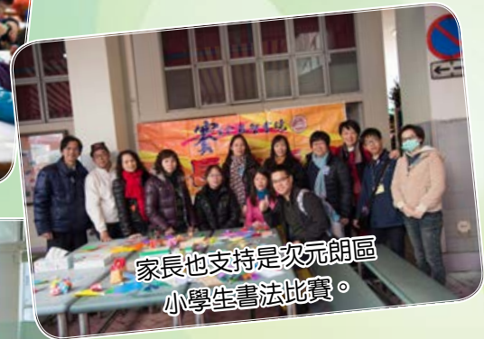
家長也支持是次元朗區小學生書法比賽。