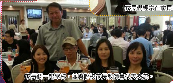
家長們一起舉杯，並與聯校家長教師會代表交流。