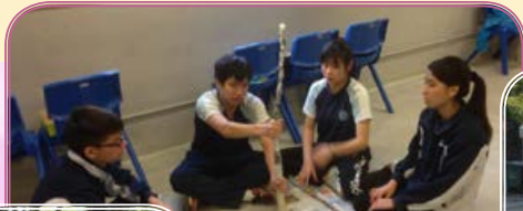
同學認真地思考解決方法。

奇「義」果義工領袖培訓計劃 社會服務繼續舉辦奇「義」果義工領袖培訓計劃，期望培養學生的領導才能，並不只是參與義工活動服務社會這麼簡單，而是學習成為一個義工領袖，培養他們的領袖素質，協助推動社會服務，建立個人自信和積極性，將來在不同的學習和工作階段能發揮所長，貢獻社會。