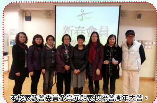
本校家教會委員參與元朗家校聯會周年大會。