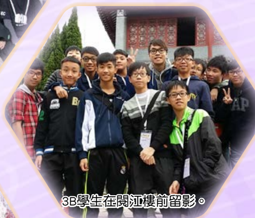
3B學生在閱江樓前留影。