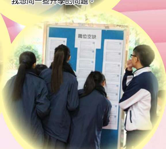
模擬放榜 — 尋找一份理想的工作真不容易。