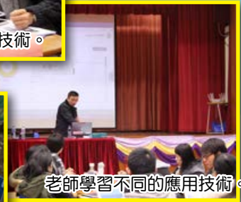
老師學習不同的應用技術。