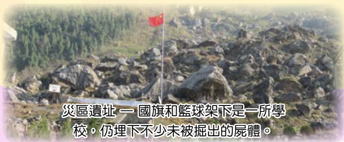
災區遺址 — 國旗和籃球架下是一所學校，仍埋下不少未被掘出的屍體。