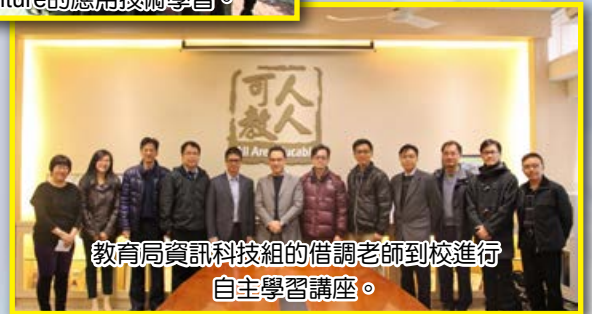
教育局資訊科技組的借調老師到校進行自主學習講座。