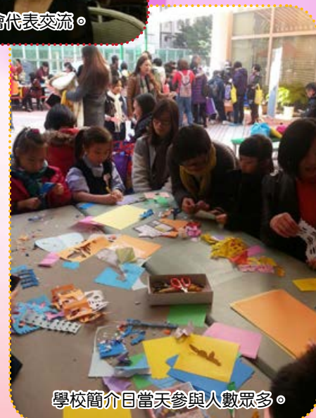
學校簡介日當天參與人數眾多。