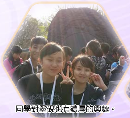
同學對墨硯也有濃厚的興趣。