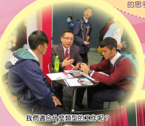
我們適合什麼類型的工作呢？

今次的參觀活動除了讓我了解到不同升學就業的資訊外，更重要的是讓我重新審視自己，對未來作出新的思考，真讓我獲益良多。