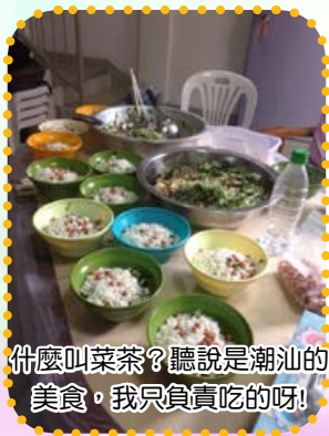
什麼叫菜茶？聽說是潮汕的美食，我只負責吃的呀！