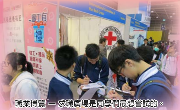
職業博覽 — 求職廣場是同學們最想嘗試的。

這次短暫的活動讓我更加清晰地了解自己的目標，也明白只有朝著自己的方向，一步一步腳印，打好每個基礎，才能讓自己活得更灑脫，過自己想要的生活。