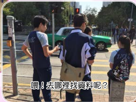
喂！去哪裡找資料呢？