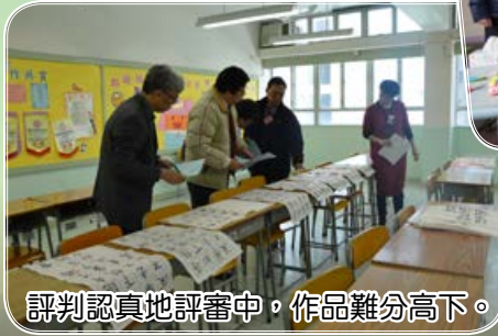
評判認真地評審中，作品難分高下。