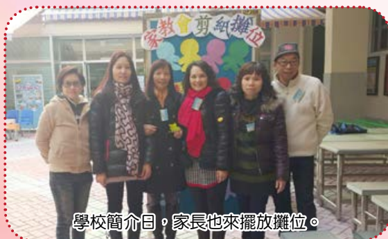
學校簡介日，家長也來擺放攤位。