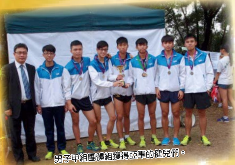
男子甲組團體組獲得亞軍的健兒們。