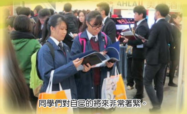
同學們對自己的將來非常著緊。

生涯規劃下半年分別有兩次大型活動，分別是中六級的模擬放榜及中五級的教育職業博覽2015。前者是中六以第一次測驗的成績，模擬在高中文憑試所獲取的等級，提早使同學經歷放榜的一刻，使他們盡早為自己將來的升學就業作出更妥善的安排。後者是每年中五級必須參加的各行各業的國際及本地職業博覽活動，使同學能預早認識升學及職業的市場，為自己將來設訂方向。