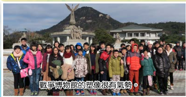
戰爭博物館的塑像很有氣勢。