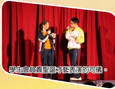
學生會負責聖誕才藝表演的司儀。