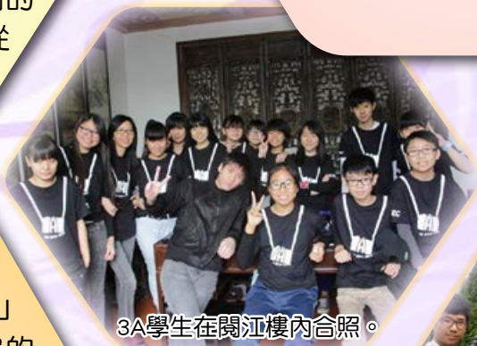
3A學生在閱江樓內合照。

在 這次旅程中，我對鼎湖山的印象是最深刻，因為它的湖水十分清澈。在陽光照射下更是閃閃發亮，令人目不暇給；湖水清澈見底，若不是導遊說湖有大概十四米深，我還真想跳下湖裏感受那冰涼、舒適。爬山的過程雖然辛苦，但上到高頂，看着下面綠油油而深不見底的山底，我的腦海浮現一種難以用言語表達的滿足感。我和同學們齊聲呼叫起來，以泄心頭興奮的感覺。瀑布的流水聲也在我心中留下深刻的印象。