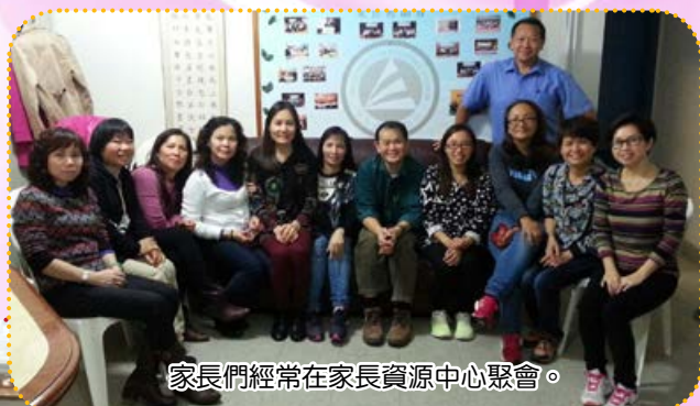
家長們經常在家長資源中心聚會。