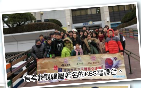
有幸參觀韓國著名的KBS電視台。