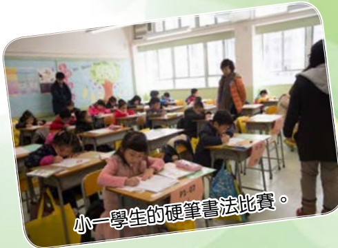
小一學生的硬筆書法比賽。