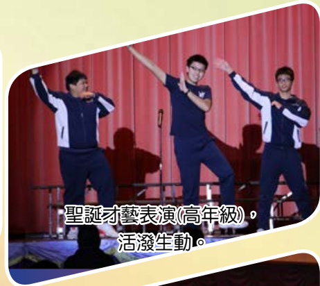
聖誕才藝表演(高年級)，活潑生動。