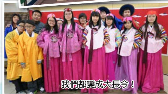
我們都變成大長今！