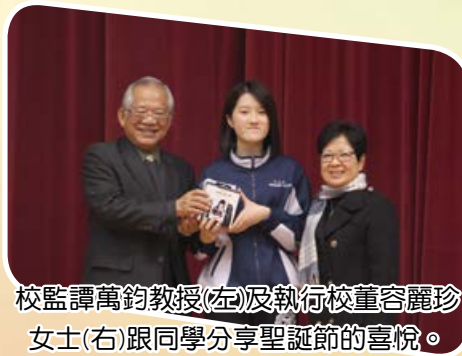
校監譚萬鈞教授(左)及執行校董容麗珍女士(右)跟同學分享聖誕節的喜悅。

本年度，我們學生會舉行了一些活動，這些活動都是能夠讓同學玩樂之餘，另可以從中學習，如訓練團體合作，以及堅毅精神。因此我們舉辦了班際閃避球比賽，以及即將舉行的三人籃球賽，讓同學們能夠一起共同合作，互相扶持，發揮我校「勤學、服務、領導」的精神。另外，學生會亦成功為同學爭取於課室內添置時鐘，讓同學培養守時的美德及時間管理的重要性。在餘下的日子，學生會仍然會繼續為同學舉辦活動，以及為同學爭取不同的福利。