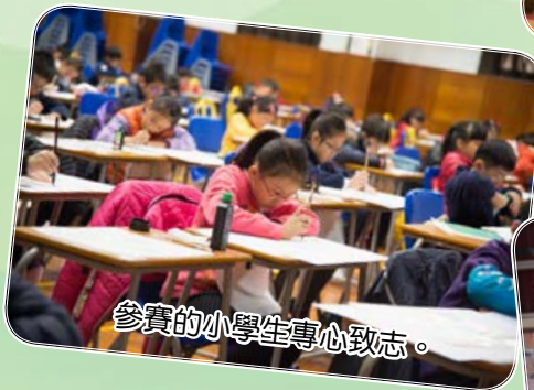
參賽的小學生專心致志。