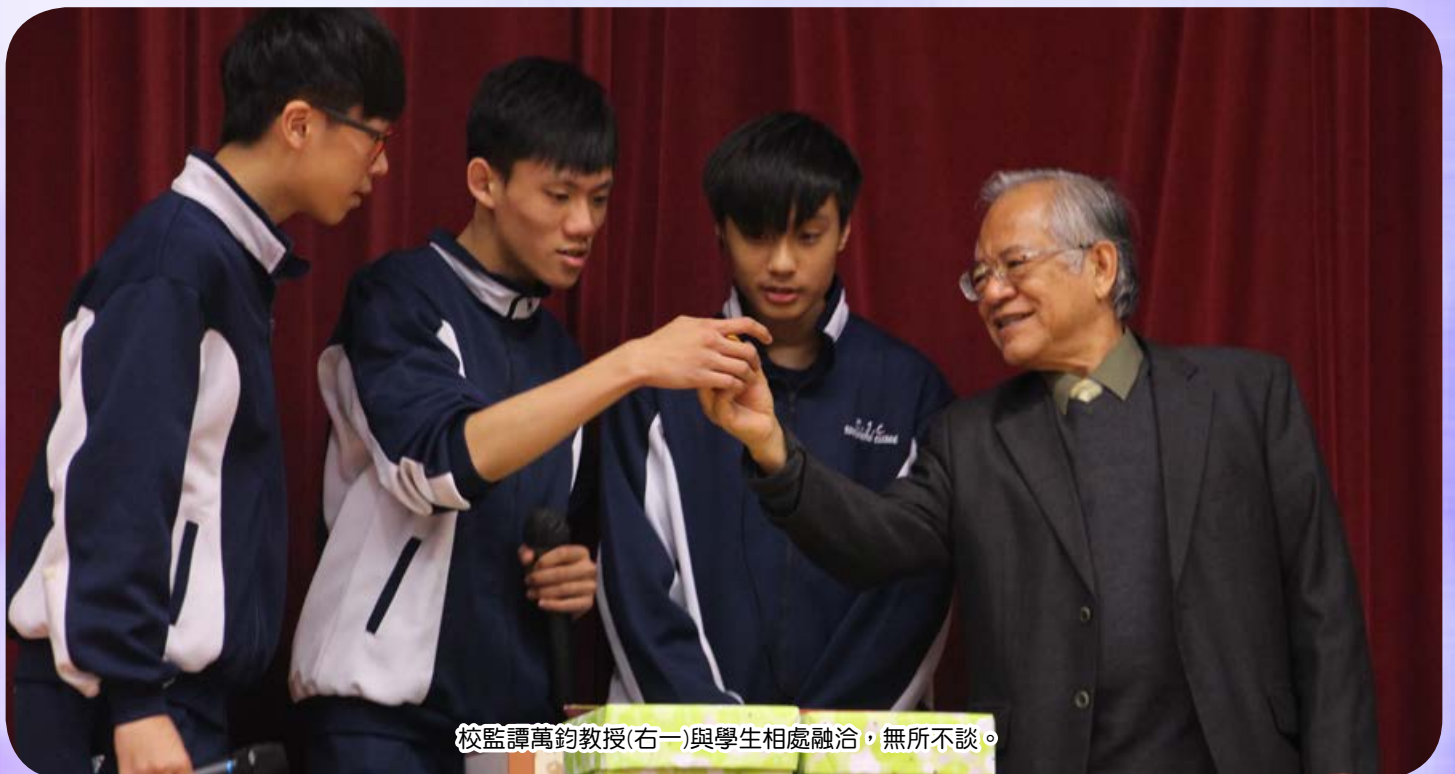
校監譚萬鈞教授(右一)與學生相處融洽，無所不談。