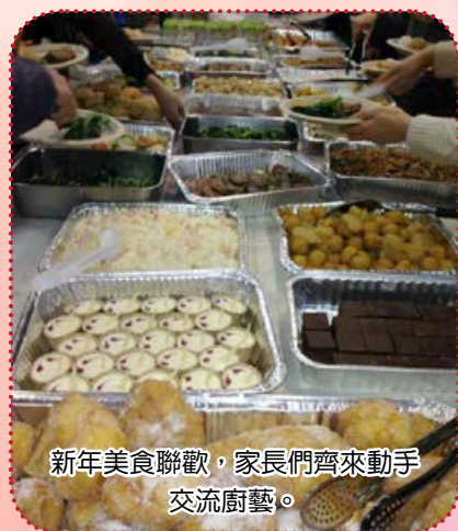
新年美食聯歡，家長們齊來動手交流廚藝。