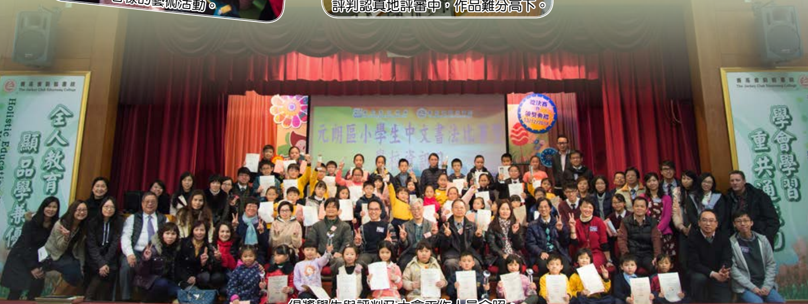
得獎學生與評判及大會工作人員合照。