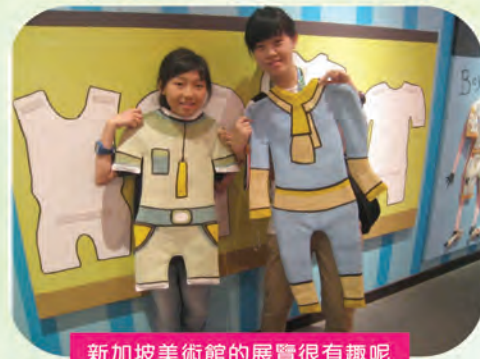
新加坡美術館的展覽很有趣呢