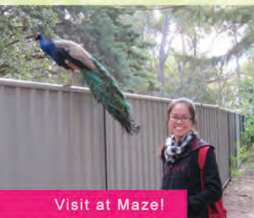
Visit at Maze!

Finally, I would love to encourage all of you to take every chance in your life to explore the world, to feel the world and to love it. You will never know how big the world can be if you don't make a move.