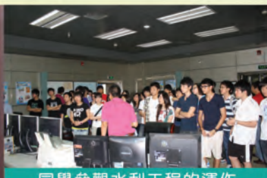
同學參觀水利工程的運作