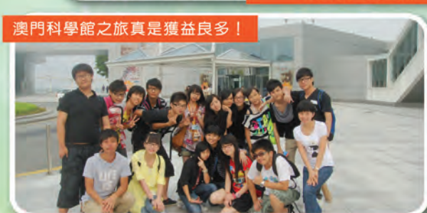
澳門科學館之旅真是獲益良多！