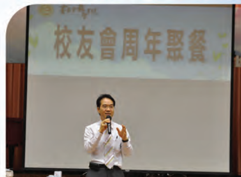
雷校長致誠的歡迎詞