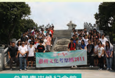
參觀袁崇煥紀念館

總括而言，是次的惠州文化考察地點保留了不少具歷史文化意義的物品，透過是次的參觀，使我認識更多當地的歷史文化及變化，也令我對文化作出了更大的反思。