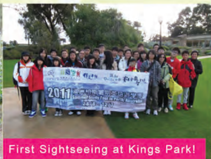
First Sightseeing at Kings Park!