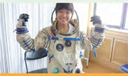
超酷的艙內航天服