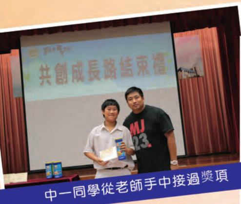
中一同學從老師手中接過獎項

透過結束禮，回顧初中學生參與『共創成長路』的成長和改變，總結及鞏固學生得著，以及嘉許表現積極及有良好表現學生。現在透過以下相片，分享得獎同學的喜悅吧！