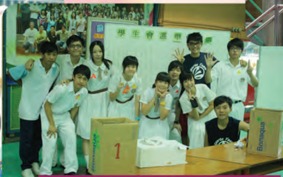
第十二屆學生會內閣成員