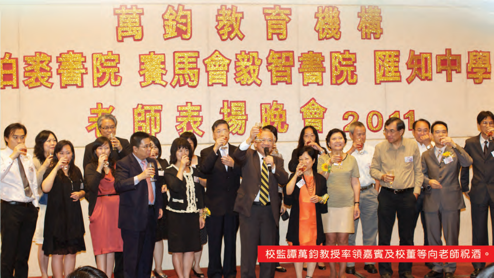
校監譚萬鈞教授率領嘉賓及校董等向老師祝酒。