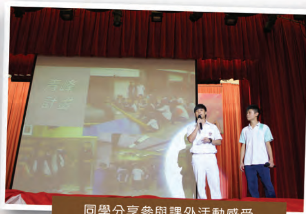
同學分享參與課外活動感受