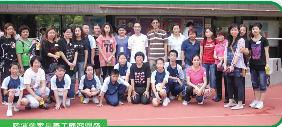
陸運會家長義工陣容鼎盛

另外，本校家教會於本年度推行「家長獎勵計劃」，家長凡參加家教會舉辦之活動，每次出席均可獲蓋印，以示獎勵。獎勵計劃設金獎（5個或以上蓋印）、銀獎（4個蓋印）、銅獎（3個蓋印）及嘉許狀（2個蓋印）。獎品包括主題樂園門票、小型家庭電器、超市禮券等，於本學年完結時頒贈予獲獎家長。希望各家長踴躍參加家教會舉辦的活動，建立「家校合作」的精神。