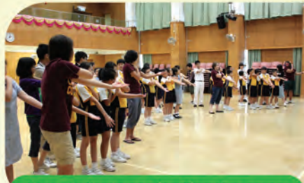
Our students are leading the camp

To conclude, I really enjoy participating in this programme. I hope I will have another opportunity to get involved in such meaningful work in the future.