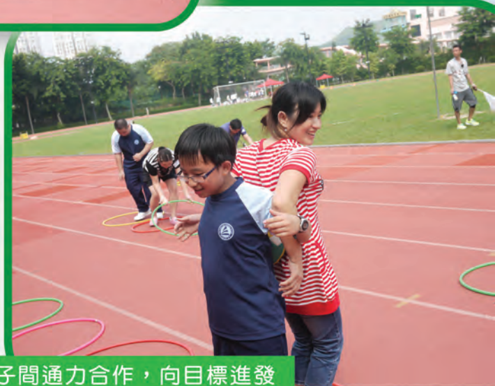
母子間通力合作，向目標進發