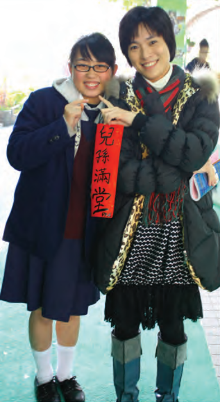
學生送揮春給老師