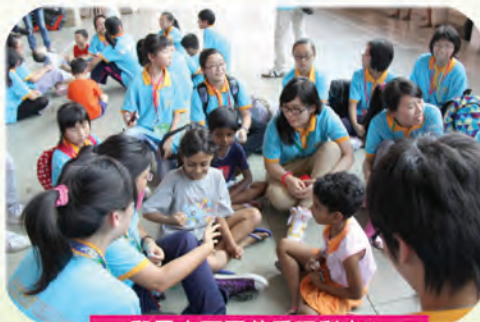
和馬來西亞慈愛福利中心的小朋友玩得很開心呢