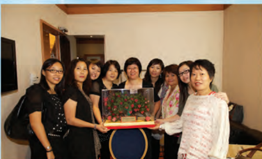
本校家長親製精緻的「桃李滿門」擺設給校監。