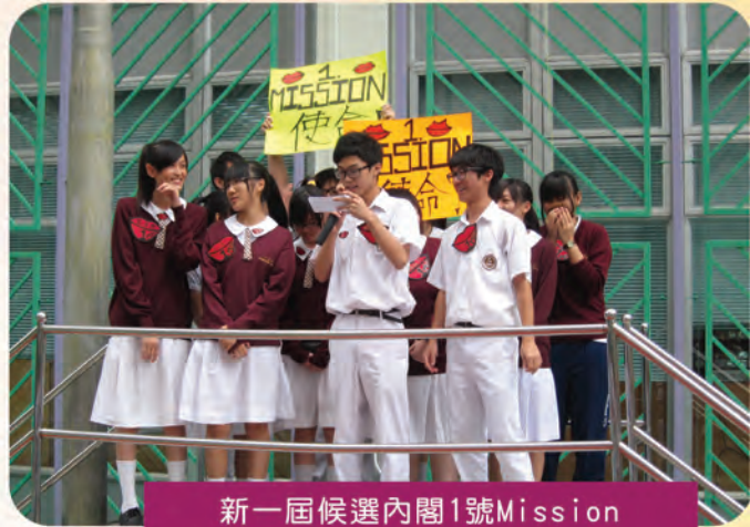
新一屆候選內閣1號Mission

而新一屆學生會選舉，參選內閣共有三個，分別為「1號MISSION」，「2號Bi-heart」，「3號零距離」。相信無論哪一個內閣當選，均會秉承學生會作為校方與學生溝通的橋樑，繼續為學生謀取福利，盡心盡力為大家服務。