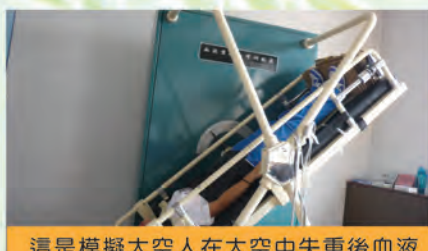
這是模擬太空人在太空中失重後血液重新分佈的機器。我被傾斜了-45度