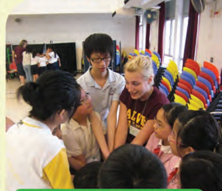
We are grouping with primary students and a foreigner