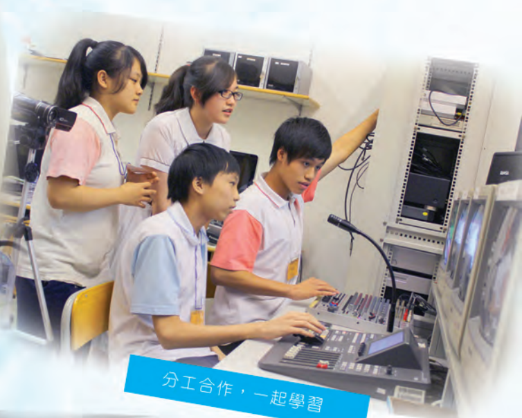
分工合作，一起學習