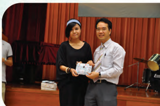
雷校長頒發獎品給幸運兒