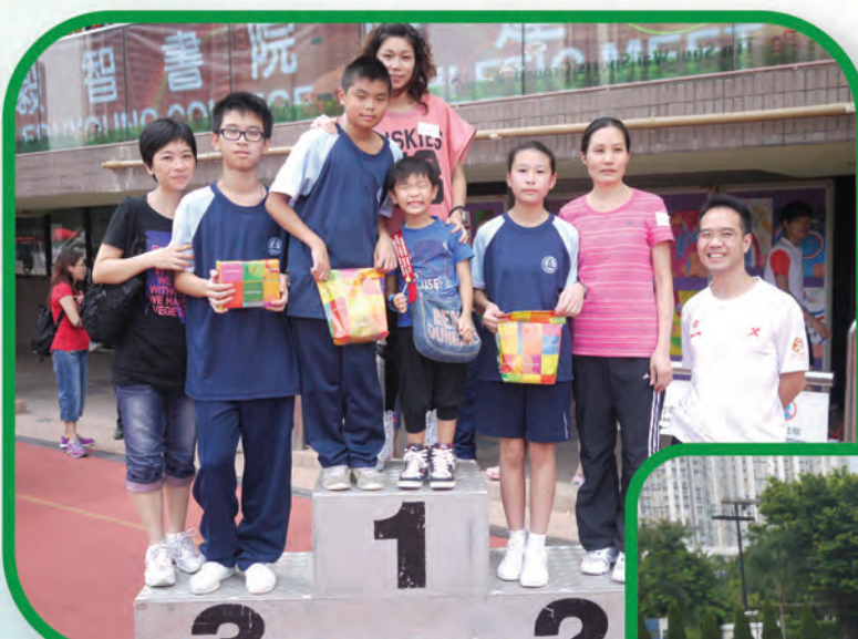
恭喜勝出親子競技的家庭