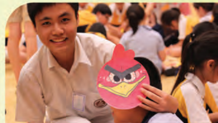
Let me help you finish your make up as an "Angry Bird"