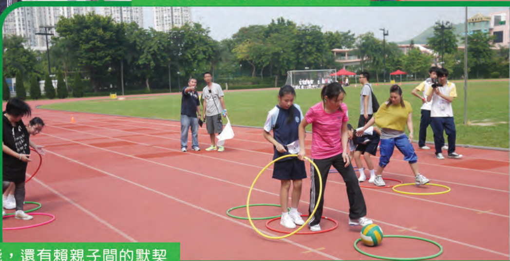
競技除考驗體能，還有賴親子間的默契