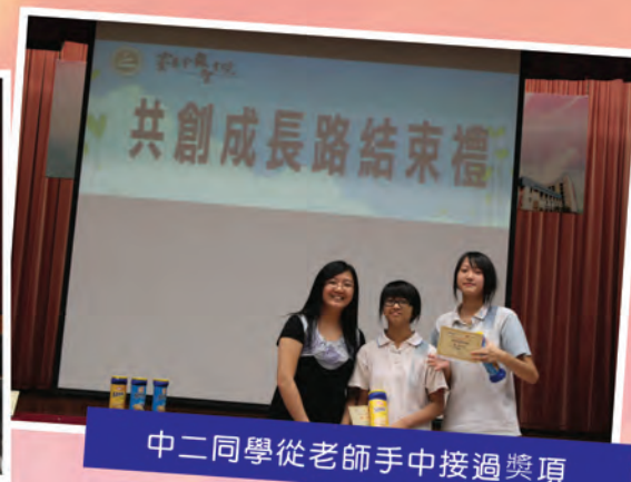
中二同學從老師手中接過獎項