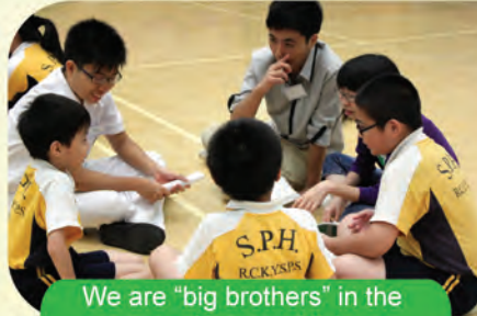
We are "big brothers" in the eyes of young children