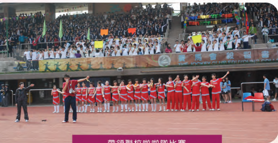
帶領聯校啦啦隊比賽