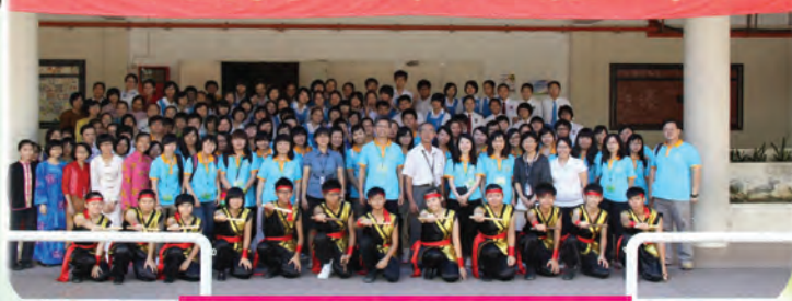
坤成中學的師生非常熱情呢

上學年，學校推薦我參加「公益少年團傑出團員獎勵計劃」，經過評選團的面談甄選後，我終於成為了元朗區的傑出團員，獲得參加「新加坡及馬來西亞交流團」的資格，可以透過旅遊活動，認識以及了解不同地方的風土人情及教育概況，以增廣見聞，貫徹公益少年團的精神——「認識、關懷、服務」。