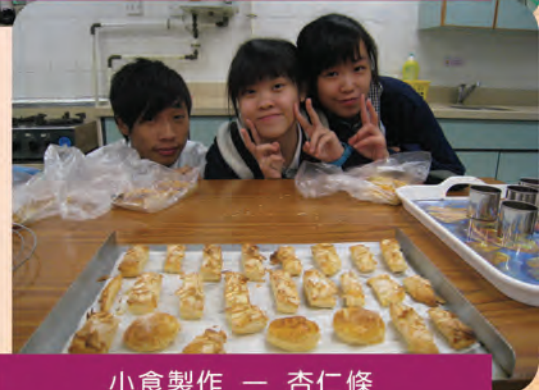
小食製作 — 杏仁條