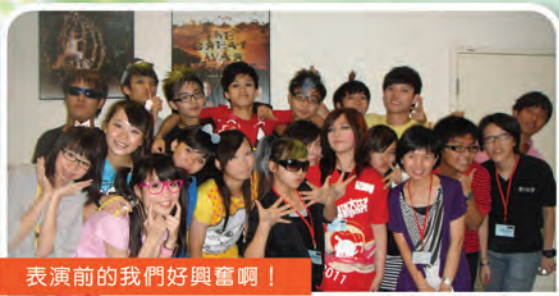
表演前的我們好興奮啊！

十分感謝老師和校長推薦我參加「公益少年團傑出團員獎勵計劃」，給予我一個難忘又愉快的經歷，令我更加認識自己、發揮自己的潛能，更加清晰地確立自己的人生目標！