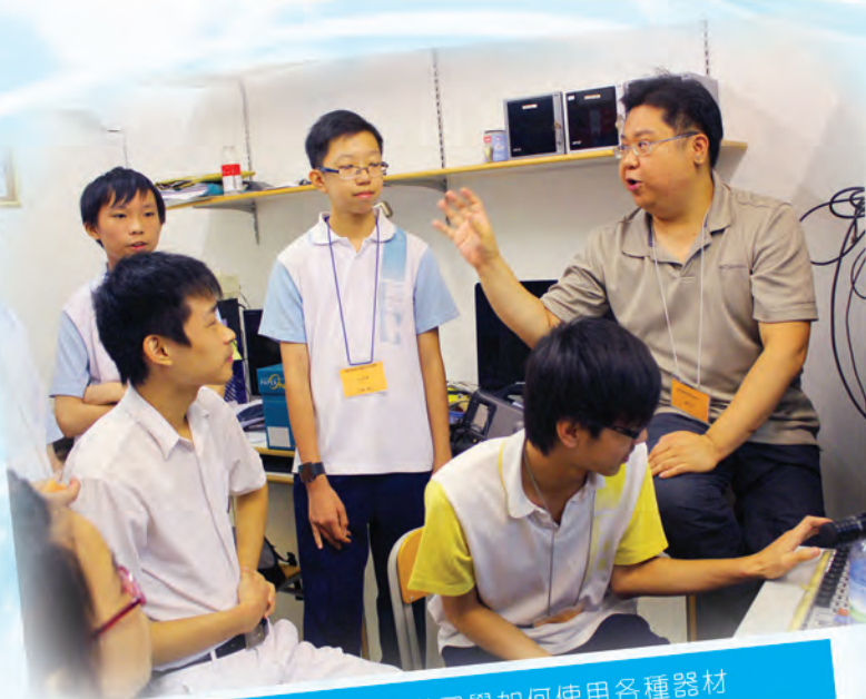
導師正指導同學如何使用各種器材

訓練完畢後，學員將會學以致用，為學校日常舉辦的活動作拍攝，亦會因應主題定期製作節目，為同學提供額外的資訊，增廣見聞。