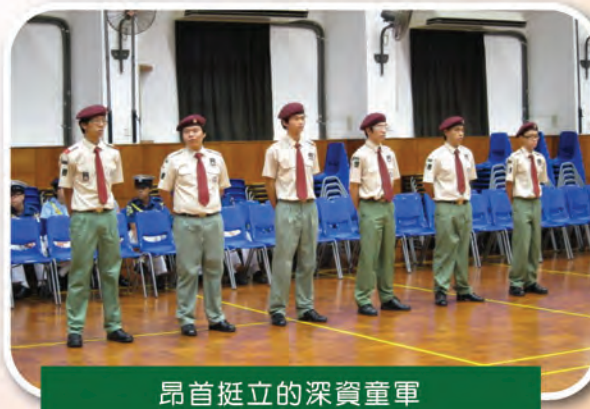
昂首挺立的深資童軍