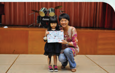
校友的囡囡也成為抽獎的幸運兒