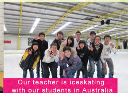
Our teacher is iceskating with our students in Australia