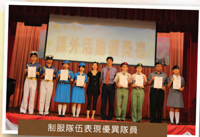
制服隊伍表現優異隊員