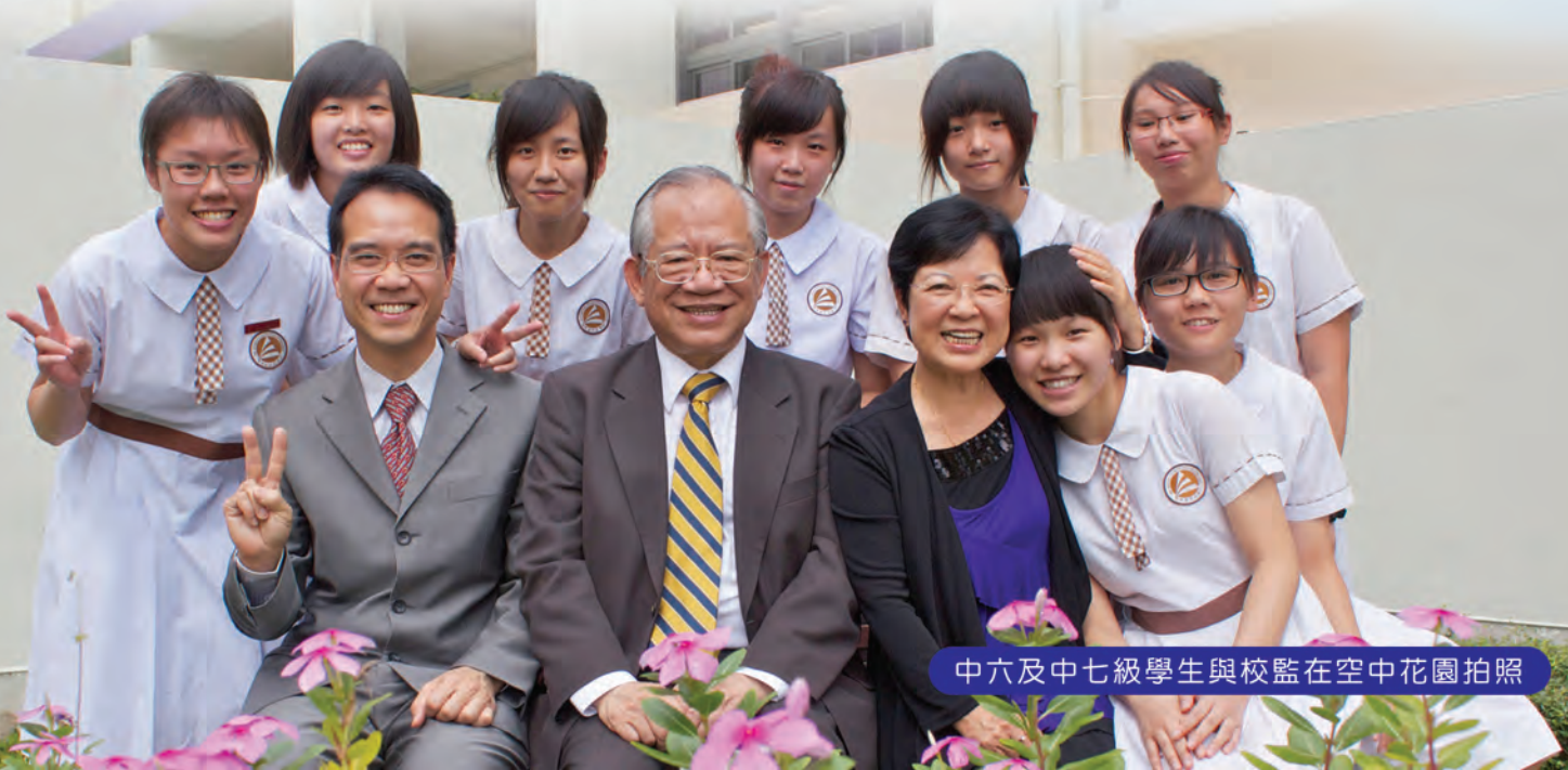
中六及中七級學生與校監在空中花園拍照

上述方法，不單是應付公開試的策略，更是應付人生路上種種挑戰的不二法門。各位同學，「有志者，事竟成」，只要你肯堅持，朝着目標，不斷努力，成功必然在望！