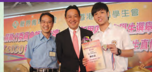
雷志康校長親臨現場與得獎同學合照。站在中間位置的是教育局副局長陳維安先生