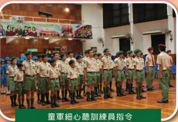
童軍細心聽訓練員指令