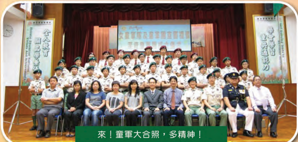
來！童軍大合照，多精神！