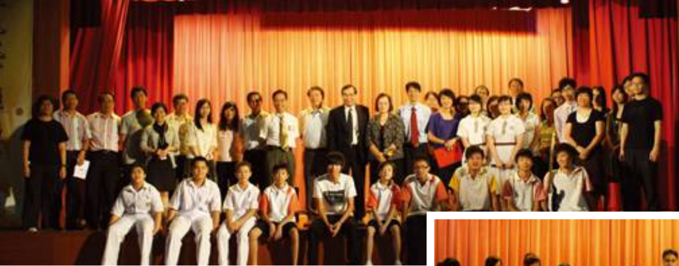
協助結業禮的嘉賓，老師和同學