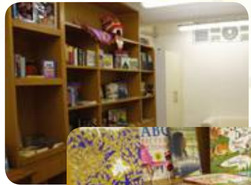
A fabulous corner