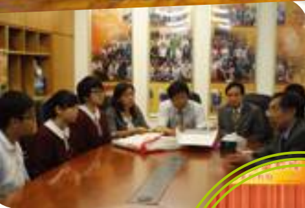
同學與嚴教授對話