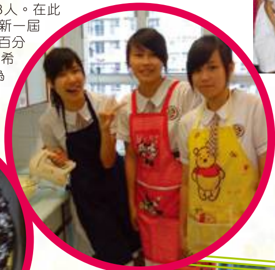
同學們製作蛋糕的情況