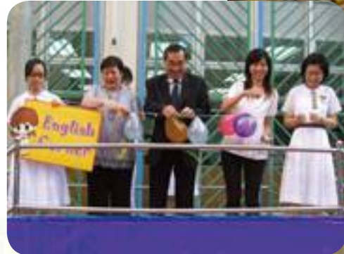
Opening Ceremony in the morning assembly