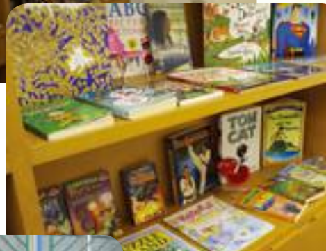
A resourceful bookshelf

It's a great place for students to develop their English skills in an environment that is relaxing and conducive to using the English language. We hope that as many students as possible, will make use of this special 'corner' of our school.