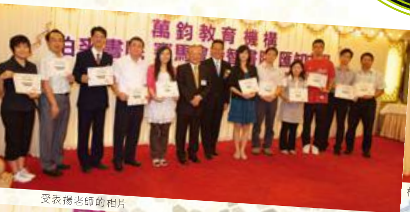
受表揚老師的相片