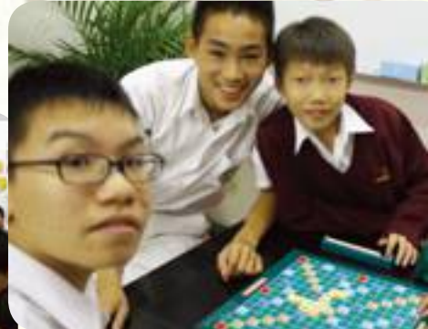
Students have fun when they are playing scrabble