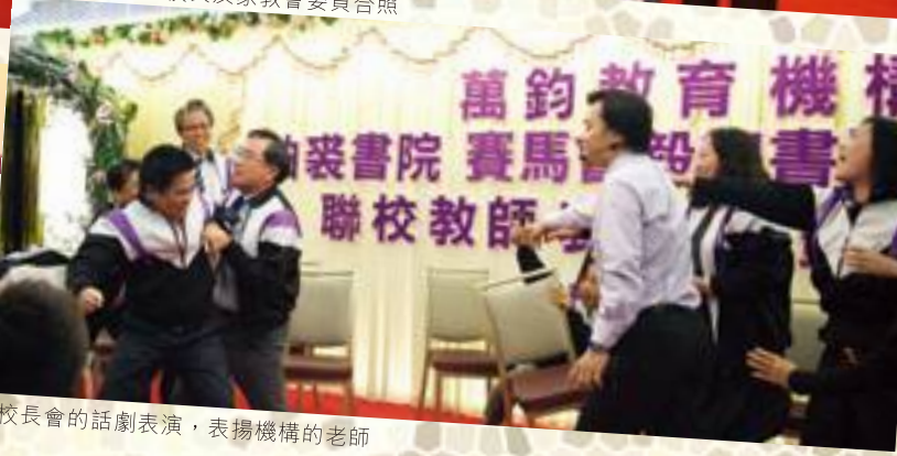
校長會的話劇表演，表揚機構的老師