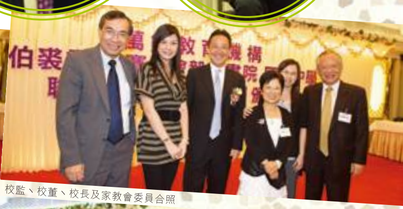
校監、校董、校長及家教會委員合照