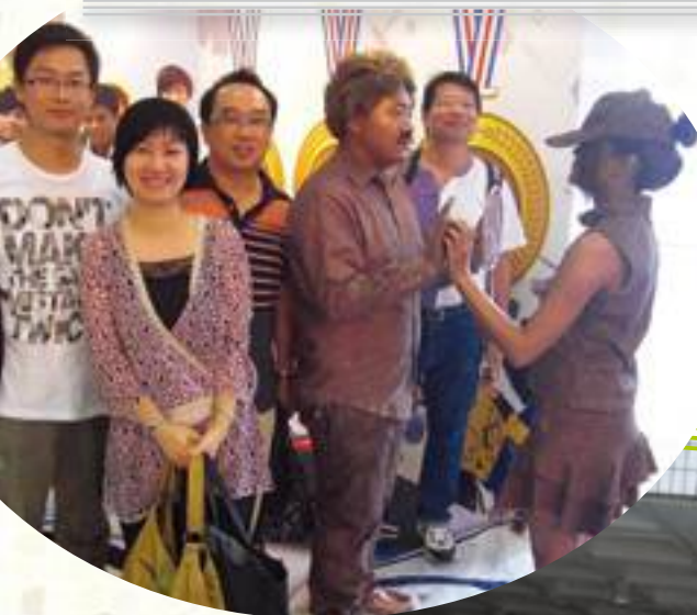
城市的學生角色扮演，惟肖維妙

為讓學生接觸多方面的升學資訊，本校安排中七級學生於十月十七日參觀香港城市大學，出席該大學舉辦的資訊日。當天有文、理、商的各系升學內容的簡介，更有專人作出主題演講。透過此參觀，同學也非常享受這半天的大學校園生活，再且對於他們未來升學就業，也有著非常實用的參考。