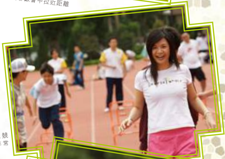
家長與子女在競技環節表演非常投入