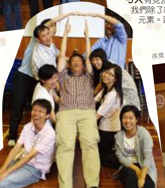
老師在團體活動中顯團結