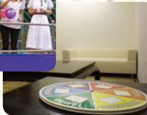
A wonderful place to stay in