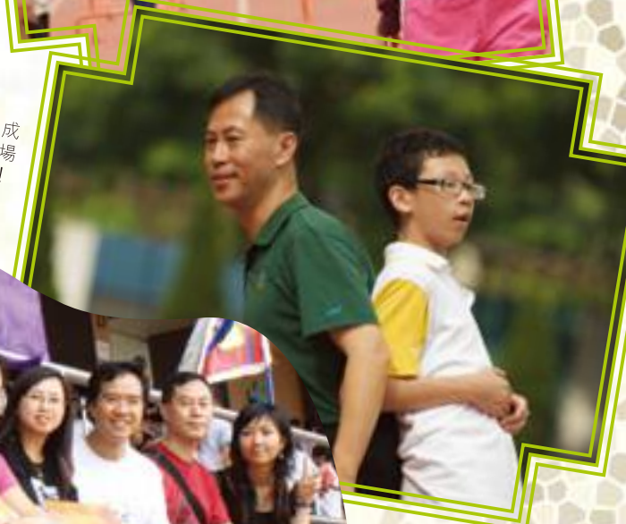
父子齊心完成競技遊戲，場面融洽溫馨！