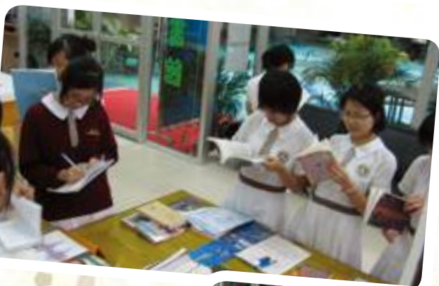
同學專注地閱讀現代史書籍