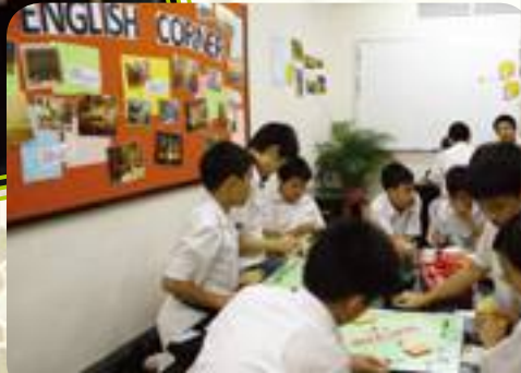
Students are enjoying themselves