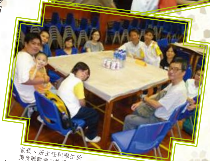
家長、班主任與學生於美食聯歡會中拉近距離