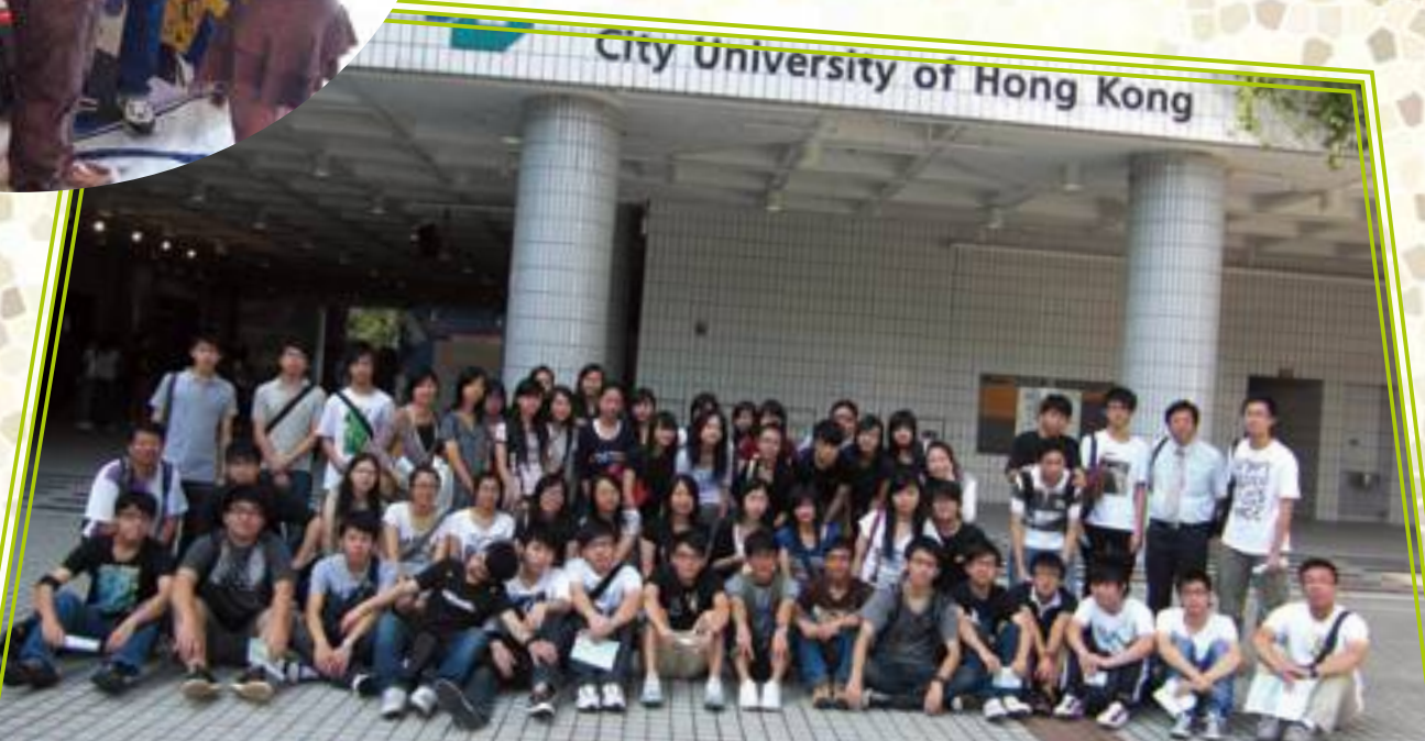
參觀香港城市大學師生大合照