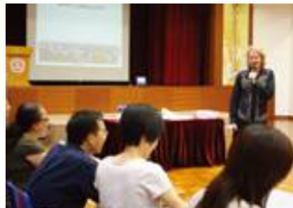
English teachers have fun in the training