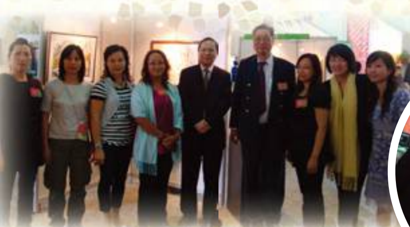
家教會會員與嘉賓一起欣賞作品

我 校的“2008-2009視覺藝術作品展”中，使我欣賞到不同範疇的藝術作品，見識到不同的創作風格，感受到毅智的創意，身為其中的一分子不禁感到自豪。展品中的中國文化藝術，包括剪紙、水墨畫和書法，更能令我體會到中華文化的精神與博大精深。