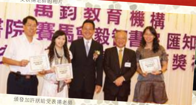
頒發加許狀給受表揚老師