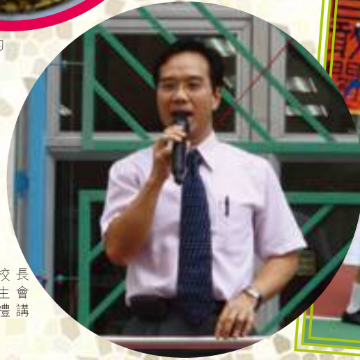
雷副校長於學生會揭幕禮講話