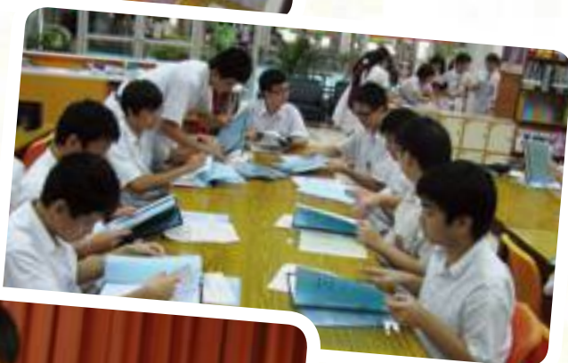
同學間分享閱書的樂趣