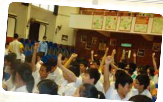
台下的同學也熱烈地爭取回答題目的機會