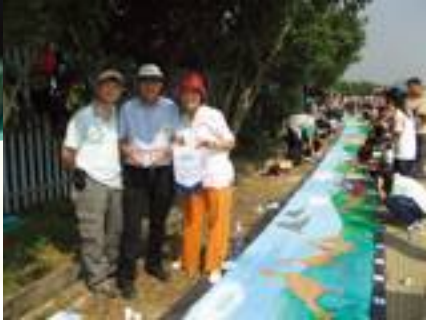
校長和美術老師齊參加