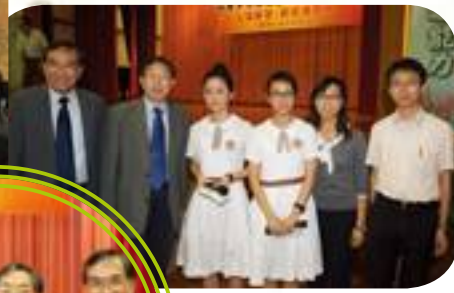
嚴教授、校長、負責老師和同學