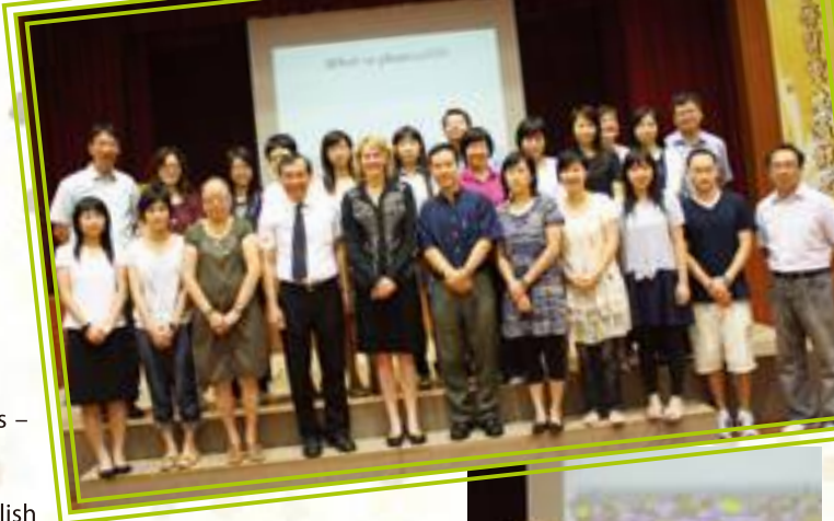
The guest speaker is introduced

The whole department takes a photo with the speaker