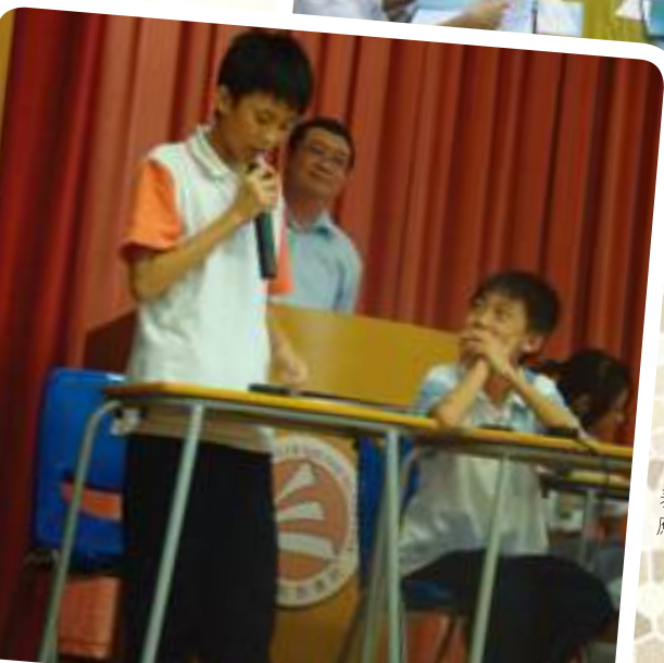
參加問答比賽中一級同學代表，認真地回應題目