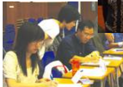
Practice activities for teachers