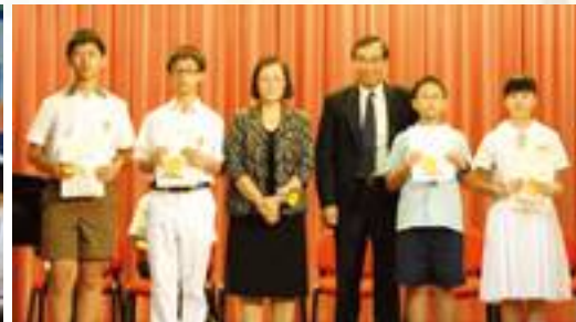
頒發獎狀給同學，以作鼓勵