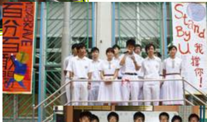
「百分百敢闖」自我介紹