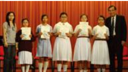
家教會副主席與校長頒發獎狀給優異同學