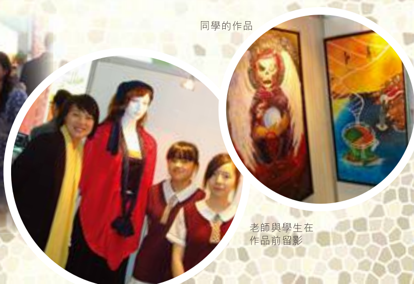
老師與學生在作品前留影