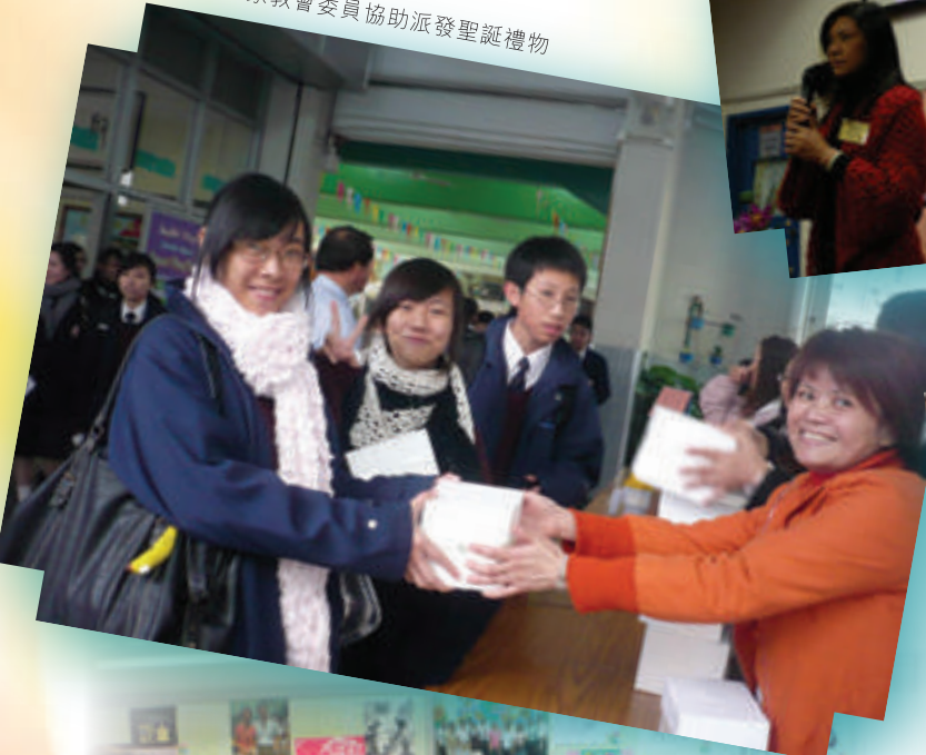
本校一眾家教會委員協助派發聖誕禮物