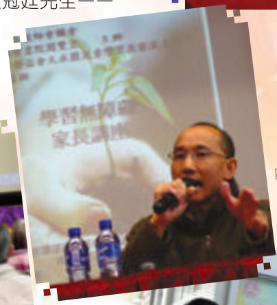
盧先生分享學生的學習問題