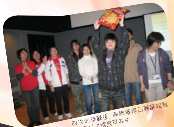
四次的參觀後，同學獲得口頭匯報冠軍，喜悅之情盡現其中

當然還有別的，可是真的太多太多，在此不能盡錄。不過，活動完結後，我就打從心底裡想：參觀活動令我充實，不會感到耗時間，所以，有機會的話，真的希望可以參加類似的活動。