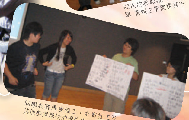
同學與賽馬會義工，女青社工及其他參與學校的學生大合照