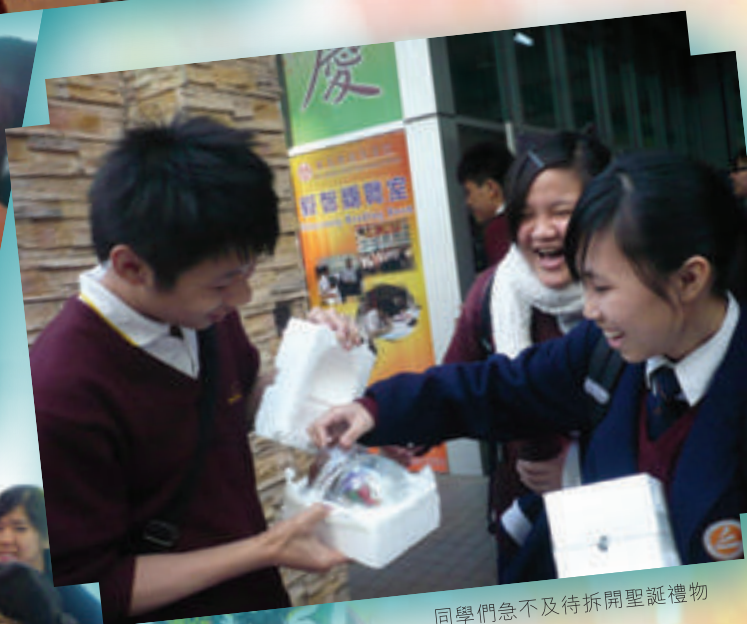
同學們急不及待拆開聖誕禮物