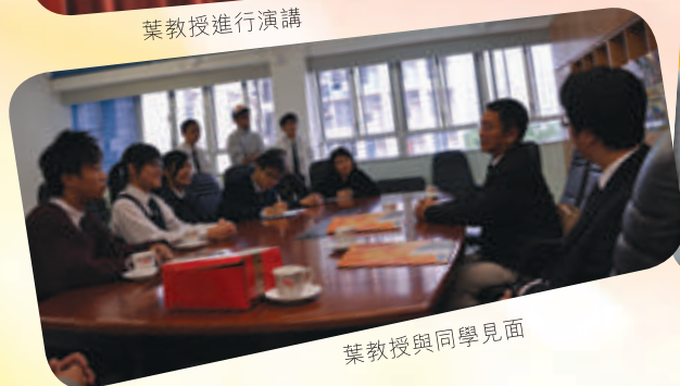
葉教授與同學見面