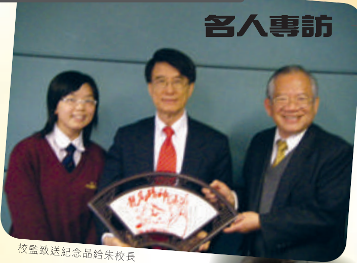
校監致送紀念品給朱校長

在2005年香港科技大學朱經武校長曾應邀出席本校之名人學術講座，是次講座已令人對這位在科學界有舉足輕重地位的人物留下深刻的印象。今年我校有幸藉著朱校長榮休之際，再次與他進行訪問。朱校長表示作為一校之長除了要有廣闊的視野，還要把目標定得高一點，即使做不到百分百，能做到百分之九十已經很好。他認為與其他地方的學生相比，香港的學生比較活潑可愛，解難能力亦高，但卻較為短視，就以選科為例，同學多以前途考慮所選的科目，而忽視個人夢想的追尋。朱校長勉勵同學要勇於嘗試，不要害怕失敗，在失敗的過程中會有更多意外的收穫。