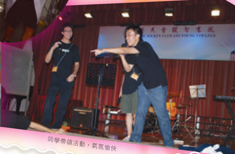
同學帶領活動，氣氛愉快