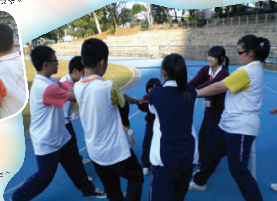
透過遊戲，學習合作