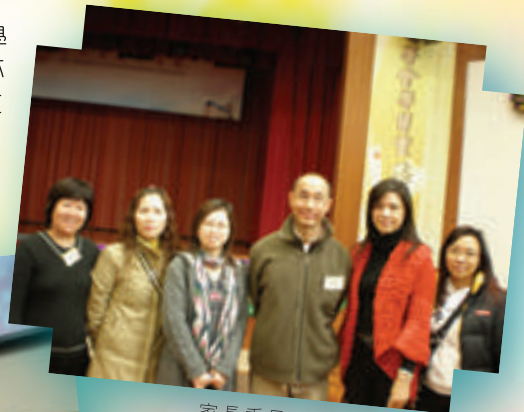
家長委員出席歌星盧冠廷主講的講座

家長教師會將延續對學校與學生的關顧，並於下學年協辦更多活動，如在二月份的家長日義賣家長親自編製的穿珠飾物及錢包，歡迎各家長踴躍到校，出席家長委員逢周二下午的例會及協助各義務活動。