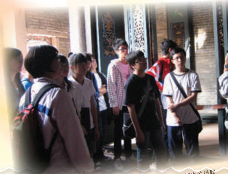
同學認真地聆聽導賞員對傳統建築物的講解