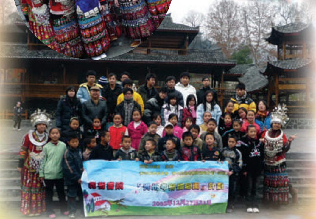
同學與當地小朋友合照

聖誕假期間本校三十多名師生參加了元朗大會堂和本校合辦的貴州文化考察及扶貧之旅。這次活動不但使學生了解當地的風土民情、政經發展、山川地貌、以及少數民族的生活狀況。期間還探訪了山區苗族小學及凱里一所重點中學，師生互相交流，了解彼此的學習情況。最後還參觀了亞洲第一大瀑布——黃果樹瀑布、青岩古鎮等等景區。這次活動師生獲益良多。