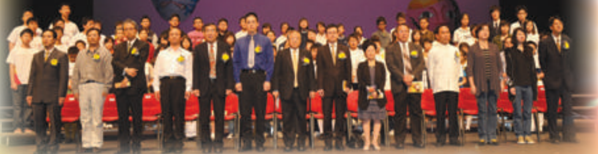
亞洲學生戲劇匯演