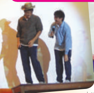
The boy is talking to the cowboy