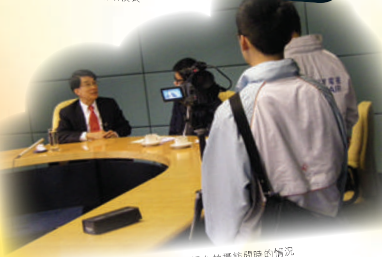
本校校園電視台拍攝訪問時的情況