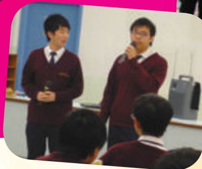
讀書會聚會中同學們踴躍分享