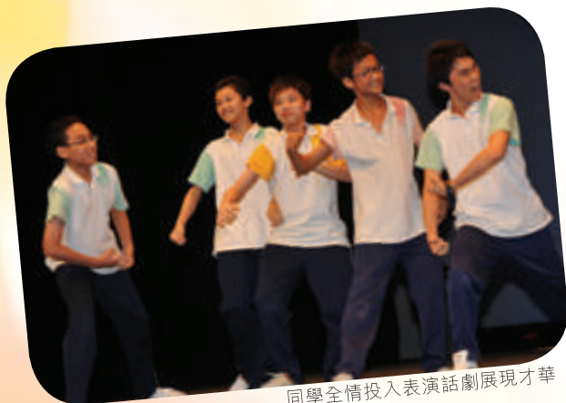
同學全情投入表演話劇展現才華

本校中文科參與香港大學知識建構學習平台計劃，學生可透過網上學習平台，發表對社會時事及文化現象的看法。計劃推展以來，參與學生表現積極投入，成效顯著。計劃一方面可開拓學生交流互動的空間，也能提升學生分析及批判思考的能力，期望學生透過參與此計劃獲得更廣闊的學習天地，真正體會學習的樂趣。