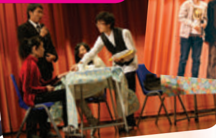
The waiter is serving his customer