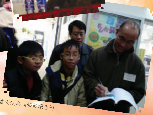
盧先生為同學簽紀念冊