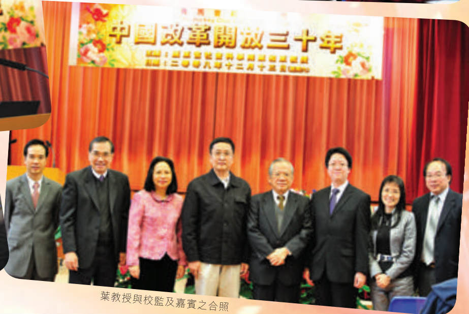
葉教授與校監及嘉賓之合照