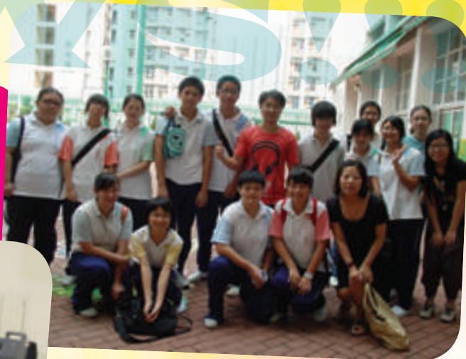
閱讀大使與作家呂宇俊先生合照

為提升校園的閱讀風氣，我校今年參加了由香港閱讀城舉辦的「悅閱學校服務08-09」。透過計劃學校成功招募一批閱讀大使，通過兩次培訓工作坊，令他們掌握組織及帶領校園讀書會的技巧。閱讀大使除以早會及展板形式向同學分享閱讀書會的活動，與同學互相交流，分享書本的啟發。在08年12月4日閱讀大使便進行了首次讀書會聚會，主題為「怪異文類之閱讀」。活動當日，閱讀大使先與同學討論不同作品中的怪異主題及當中的表達手法。同學們都對此深感興趣，分組討論後，由各組派代表分享閱讀經驗及感受。