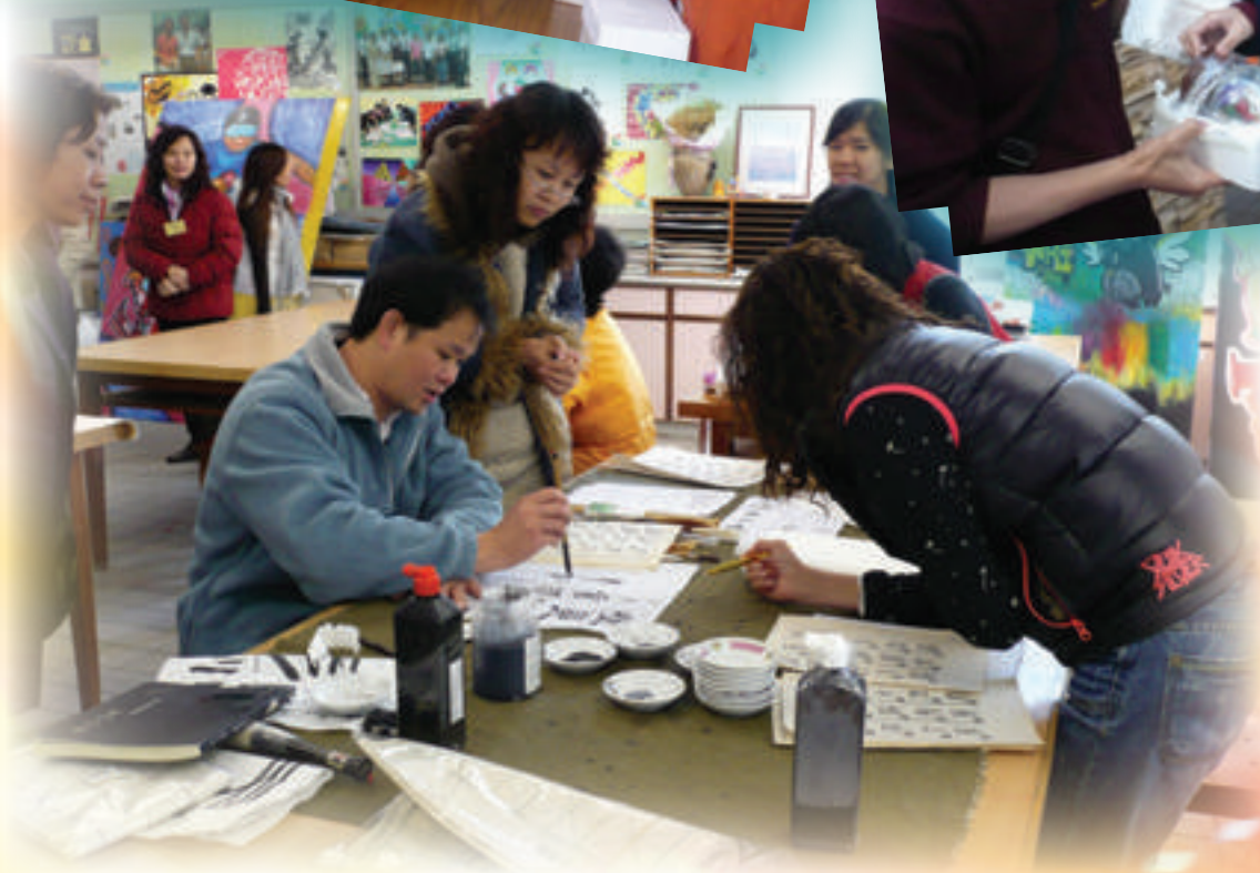
簡笄堅老師細心執教家長書法班