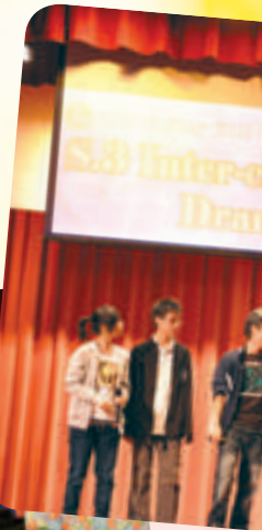
Some characters of 3A