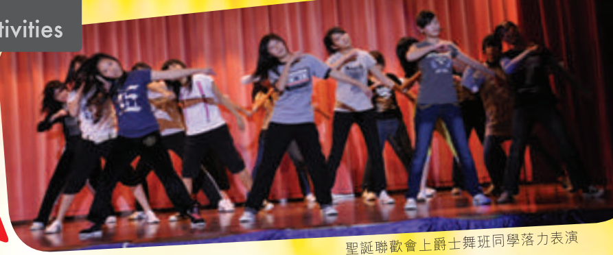
聖誕聯歡會上爵士舞班同學落力表演